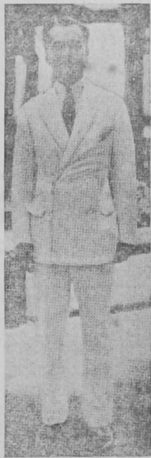
MANUEL QUEZON, Presidente de las Islas Filipinas, que nuncia su viaje a Costa Rica. Quezon es una figura de fuerte simpatía en los círculos latinoamericanos del mundo.—Lea la información en la página 2