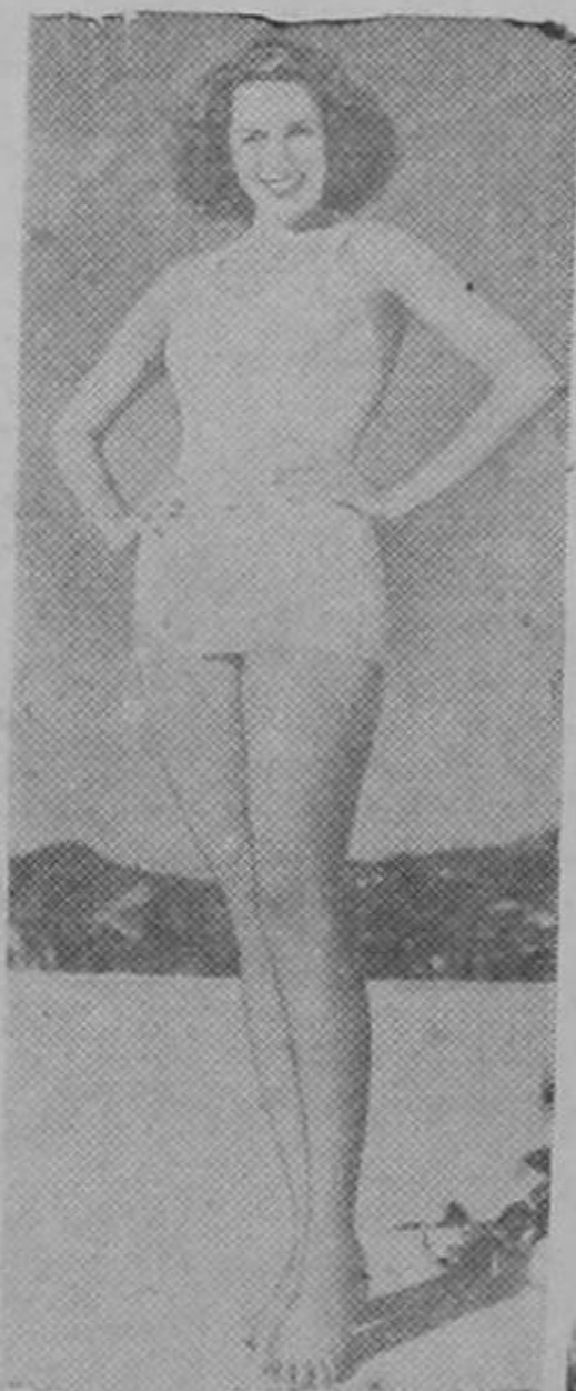
Rita Hayworth, la conocida actriz del cine, ha salido últimamente elegida entre cientos de competidoras, la más linda pelirroja del mundo.