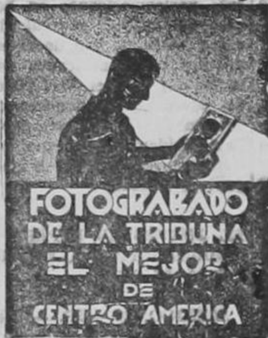
FOTOGRAFADO DE LA TRIBUNA EL MEJOR DE CENTRO AMERICA

capitán de la provincia que logró rápidas ventajas no pudo mantenerlas posteriormente ante la presión que un tanto desordenadamente ejerció luego su contrario. Ya igualadas las posiciones fue Estudiantes otra vez quien llevó la mejor parte, pero encontró una defensa muy sólida y difícil de quebrar. En La Plata, Gimnasia y Esgrima cayó vencido por San Lorenzo de Almagro en un cotejo de acciones vivaces. La lucha no decayó en ningún momento en su interés y la victoria de estos últimos se justifica perfectamente. Aunque su ventaja fue magra sus méritos fueron mucho mayores. Huracán y Platense e Independiente y Banfield dividieron honores en una lucha brillante y que mostró a dos equipos de gran calidad y éstos en un cotejo que tuvo su mayor atracción en el alto score y que reveló que Independiente sigue sin poder hallar la fórmula de la victoria que parece haberse perdido con la desertión de Arsenio Erico.