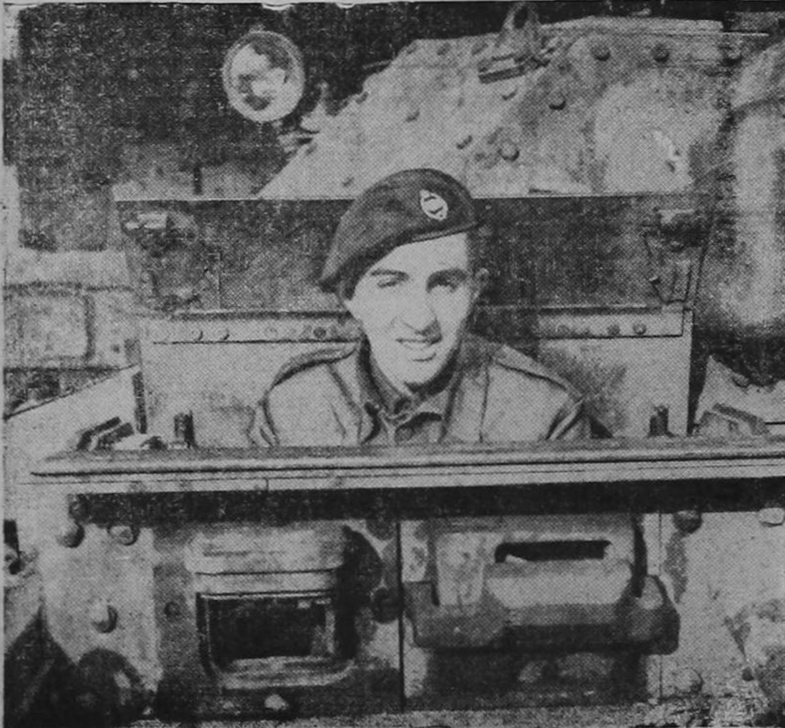
Este muchacho, de sonrisa amable y dulce, está llevando a cabo la más honrosa tarea de tiempos, manejar un tanque que contribuya a derrotar al enemigo.