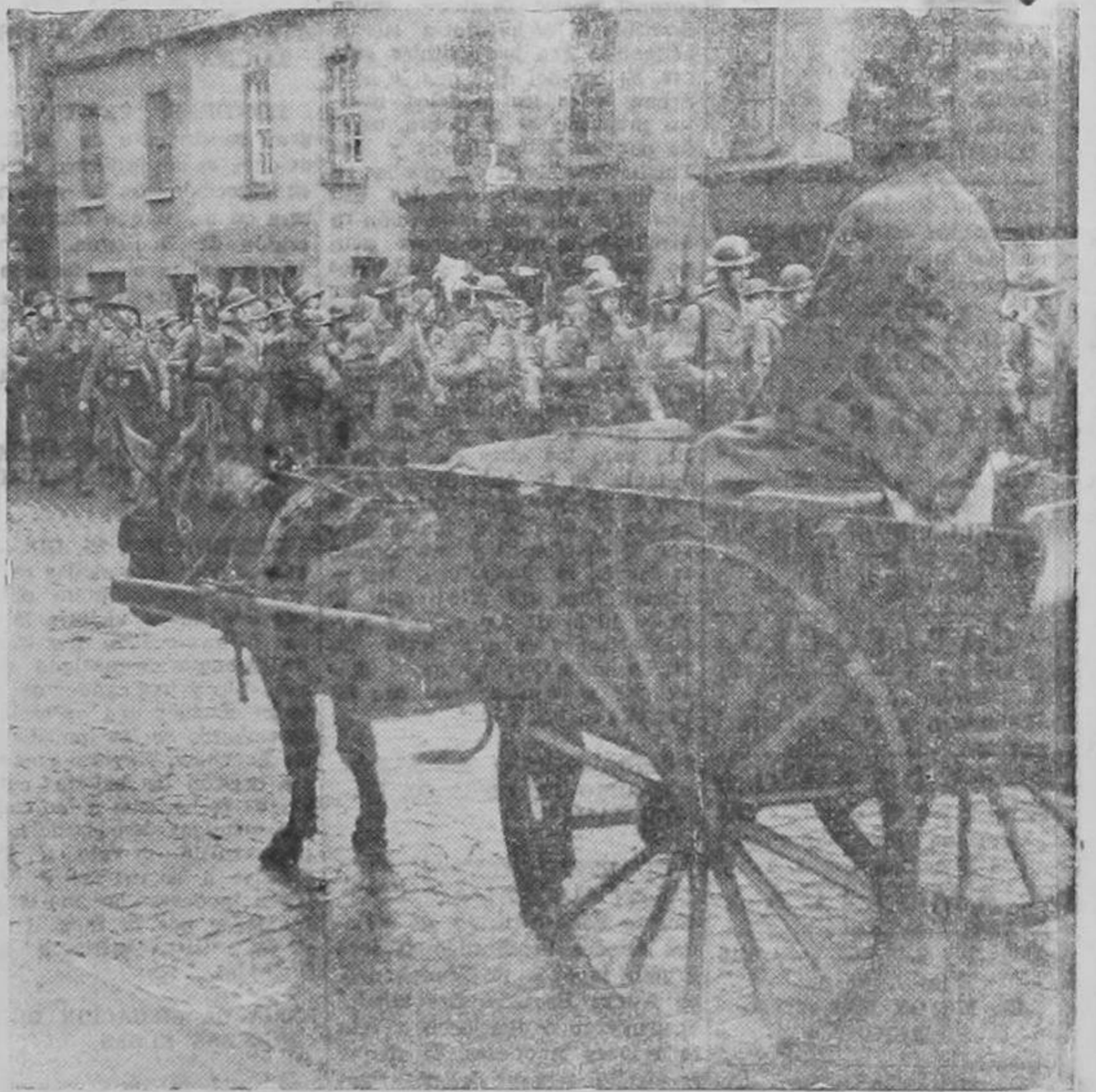
Soldados americanos en formación marchan por calles de Irlanda dirigiéndose a los cuarteles para ser revistados por el Comandante General Russell. La carreta con el pollino hace sereno contraste con el regimiento en marcha.