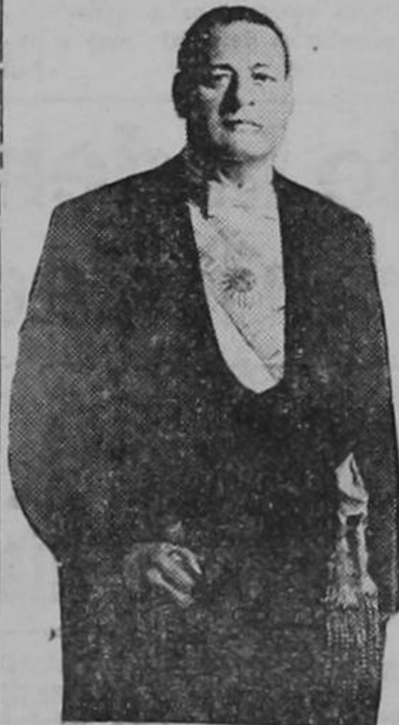
Excmo. Sr. Dr. don ROBERTO ORTIZ, Presidente de la Argentina

con nosotros convive y formula cordiales votos por el constante engrandecimiento de aquella floreciente nación.