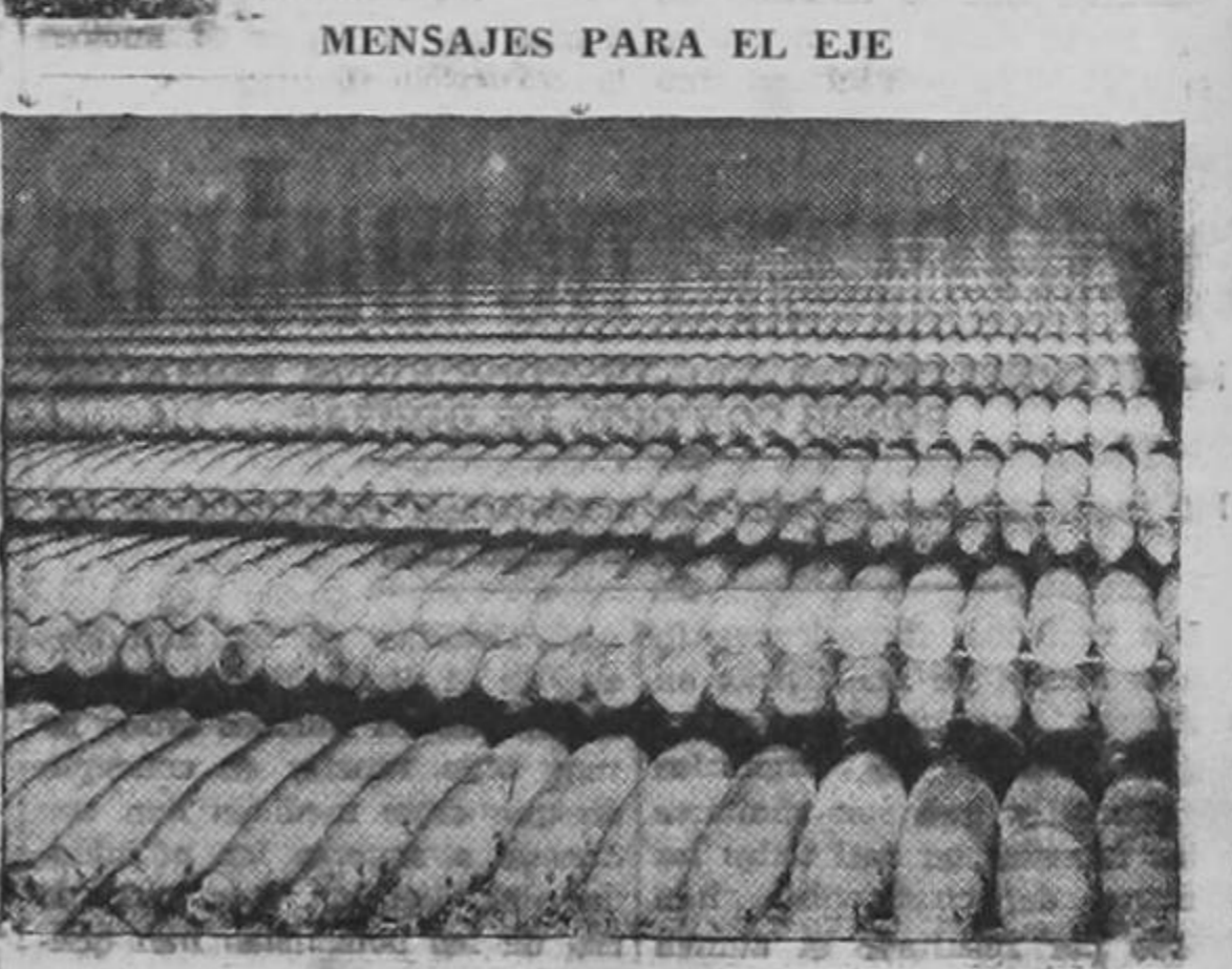
Enormes cantidades de proyectiles, en espera de ser transportados a los diversos frentes de batalla. Obuses de 155 m. m. lanzan estos proyectiles que contienen, cada uno, 95 libras de poderosos explosivos.