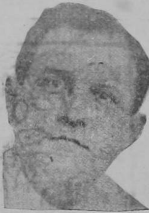
Excmo. señor doctor don