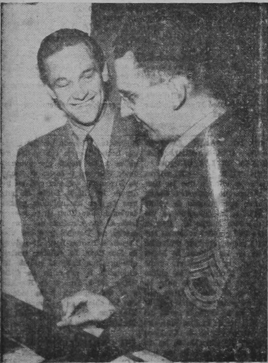
Un sargento norteamericano toma las impresiones digitales al autor cinematográfico William Holden, quien se alistó como voluntario en el cuerpo de señales y comunicaciones de las fuerzas armadas.