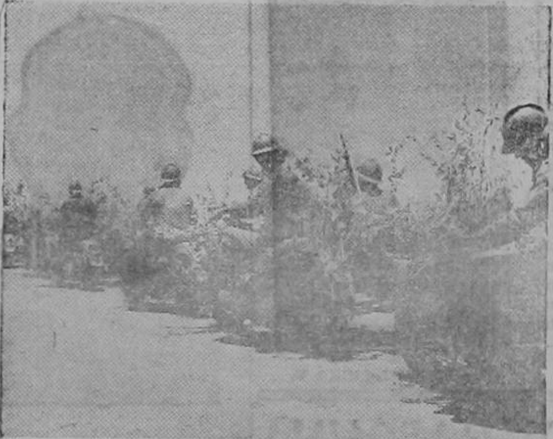
Fuerzas motorizadas mexicanas en camino hacia la zona de operaciones durante el desarrollo de recientes maniobras. México ha declarado la guerra a las potencias del Eje y está acelerando la preparación militar de sus magníficas y brillantes tropas.