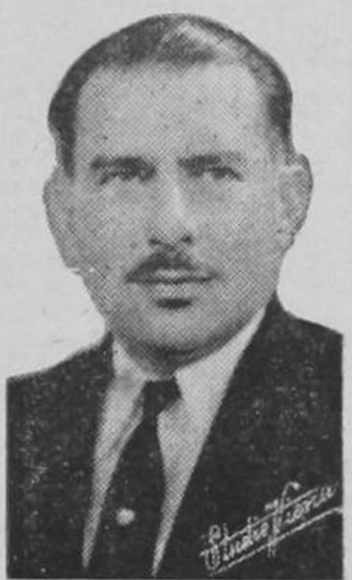
Lic. don TEODORO PICADO