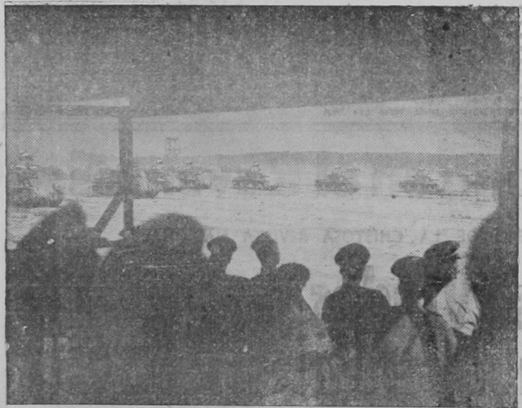
Representantes de la Junta Interamericana de Defensa asisten a una demostración de las fuerzas armadas norteamericanas. Tanques medianos, armados con cañones de 75mm, desfilan ante la tribuna presidencial.