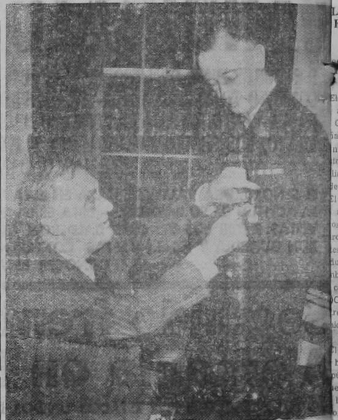
El Presidente de los Estados Unidos, Franklin D. Roosevelt, condecora, en la Casa Blanca, al Vicealmirante Wilson Brown, de la Marina de los Estados Unidos, con la medalla por servicios eméritos. La condecoración le fué conferida por los servicios prestados como Comandante de un escuadrón naval en el Pacífico.