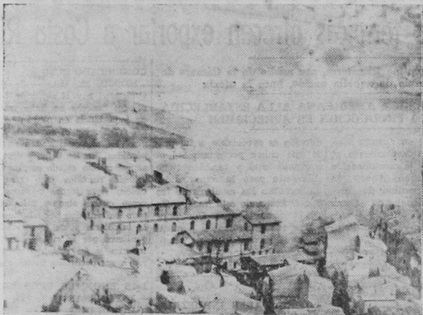
Los ingleses están atacando duramente Trípoli, el último baluarte que le queda al Eje en el África del Norte. La fotografía muestra los cuarteles de Mellaha, cerca de Trípoli, bajo el fuego destructor de las bombas de los aviones ingleses.