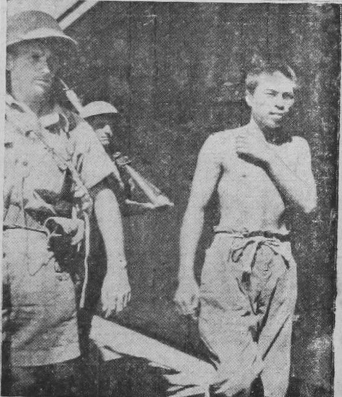
Aviador japonés, derribado en las cercanías de Port Moresby por la aviación norteamericana, camino del campo de concentración.