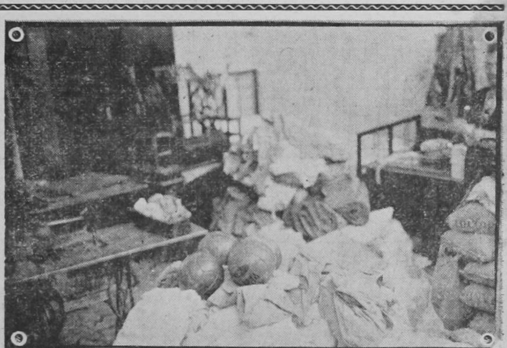
La foto muestra una pequeña parte de la mercadería decomisada ayer y esta mañana por la policía nacional en diferentes sitios de Barrio Keith Hatillo y La Uruca. Máquinas de escribir, de coser, muebles, sedas, etc. están aquí hacinadas en unos departamentos de la Estación de Policía.

A las once de la noche, la ciudad entró en calma. Dos horas.— (PASA a la Pág. NUEVE)