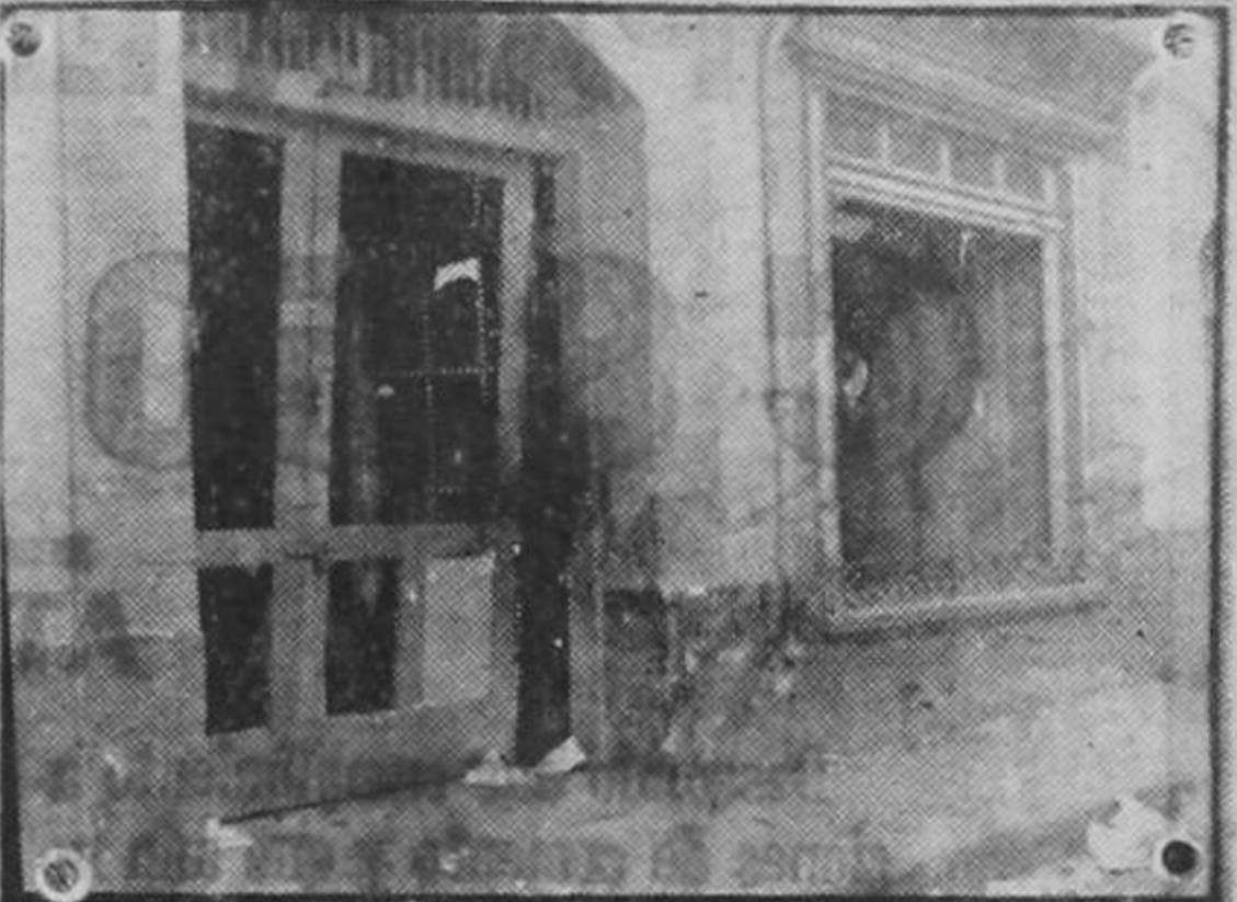
Estado de las puertas del almacén de Reimer después de la tremenda lapidación de que fueron objeto.

A las personas en cuyo poder se encontraron estas cosas se les detuvo y están en el cuartel de policia. Se les pasará a la agencia principal de policia judicial para su juzgamiento conforme a derecho. Las pesquisas de la policia seguirán durante todo el día.