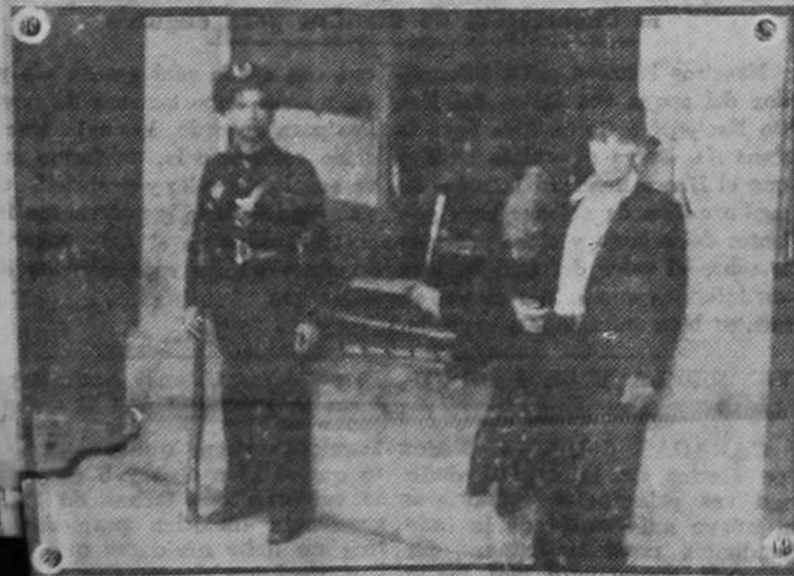
Estado en que quedó la Foto Sport.

Numerosos quinta columnistas han sido detenidos en la mañana de hoy, según se nos avisa a las once de la mañana. La lucha contra los traidores será implacable, por parte de las autoridades constituidas.