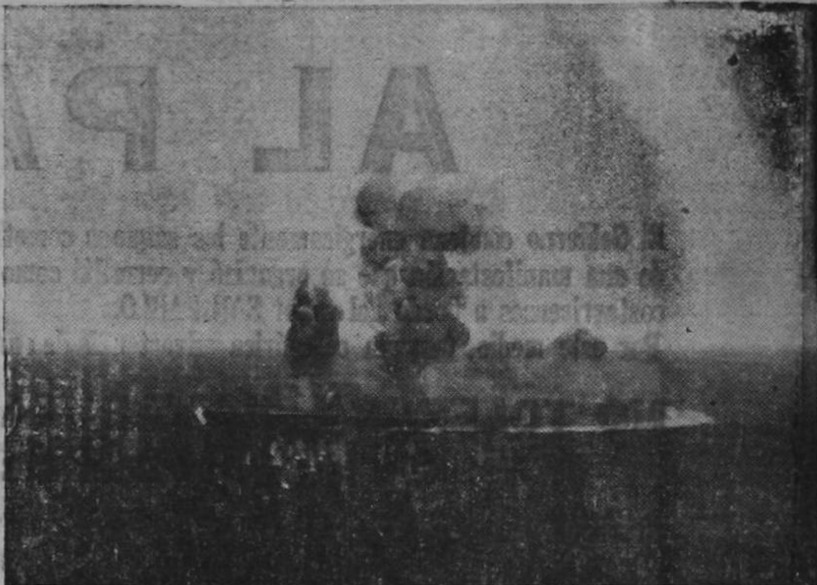
Un portaviones japonés de la clase Shokako, envuelto en llamas, después de un feroz ataque de la aviación norteamericana durante la batalla del Mar de Coral. Densas columnas de humo se levantan hacia el cielo, mientras la nave se hunde lentamente en medio de trágicas y terroríficas explosiones.