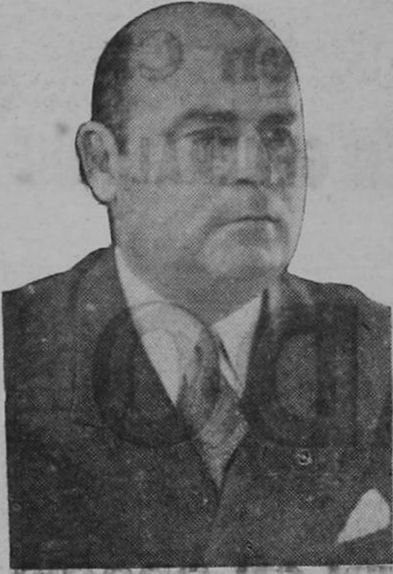
Excmo. señor General don ISAIAS MEDINA Presidente de la República de Venezuela