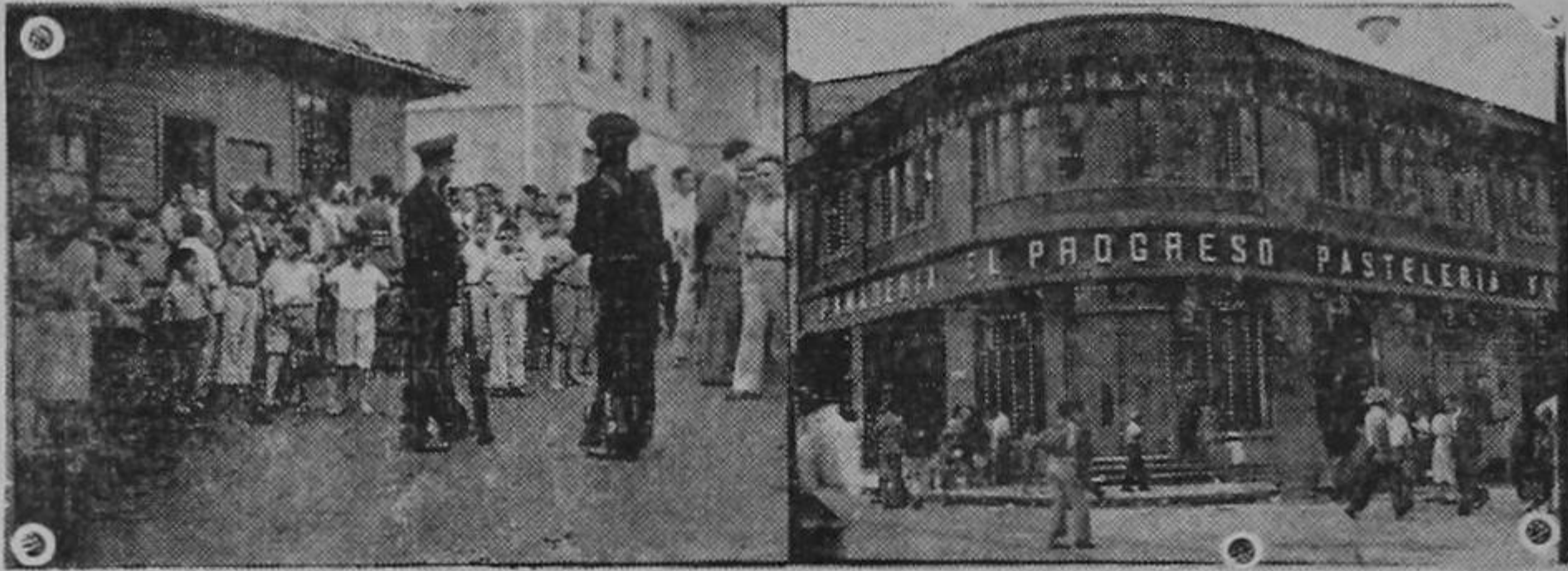
Dos fotos de los acontecimientos de ayer en la mañana frente a la Panadería Musmanni: el resguardo accionando contra los grupos que querían repetir el asalto a los hornos de esa fábrica. Un aspecto de las ruinas de dicha fábrica.

LONDRES, 5. UP. Informaciones radioemitidas por la estación de Moscú informaron que en escaramuzas recientes que han tenido lugar en la región fronteriza yugoeslavo-albanesa, las tropas italianas sufrieron sesenta muertos y cien heridos a manos de las guerrillas compuestas de patriotas de los países ocupados por el eje.