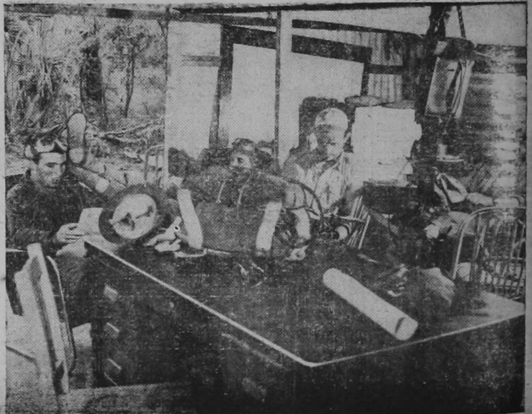
Pilotos norteamericanos, entregados a la lectura, mientras esperan en una base secreta situada...