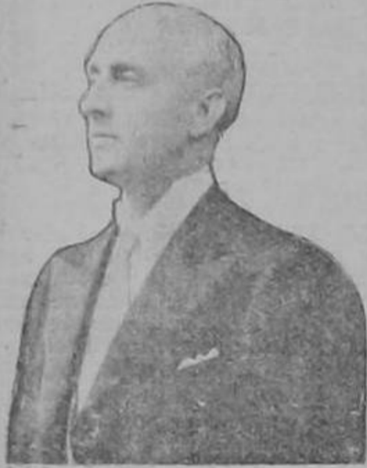
Excmo. señor doctor don MANUEL PRADO Presidente de Perú