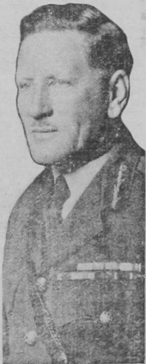
General AUCHINLECK cuyas fuerzas han iniciado una vigorosa acción contra las columnas de Rommel en El Alamein.