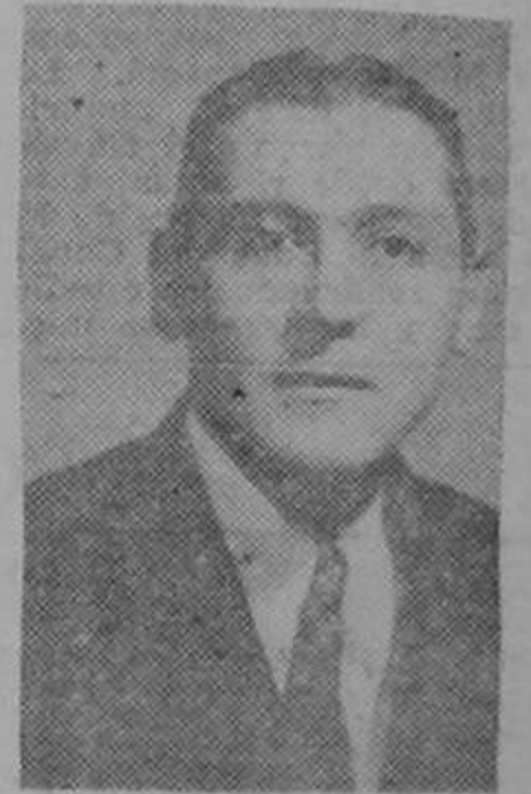
Don LEONIDAS PONCE Cónsul del Perú en Puntarenas