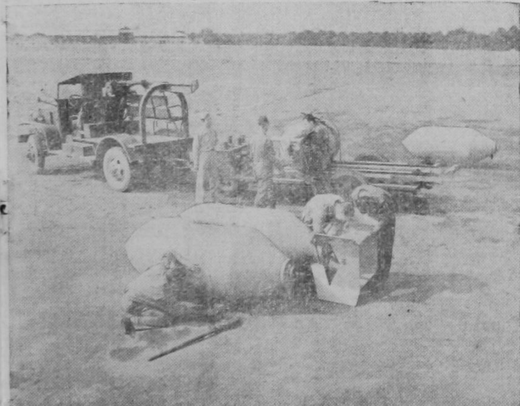
Soldados del Cuerpo de Aviación de los Estados Unidos preparando un cargamento de gigantesca bombas para los bombarderos norteamericanos. Los destrozos causados por los poderosos explosivos que contienen son verdaderamente terroríficos.