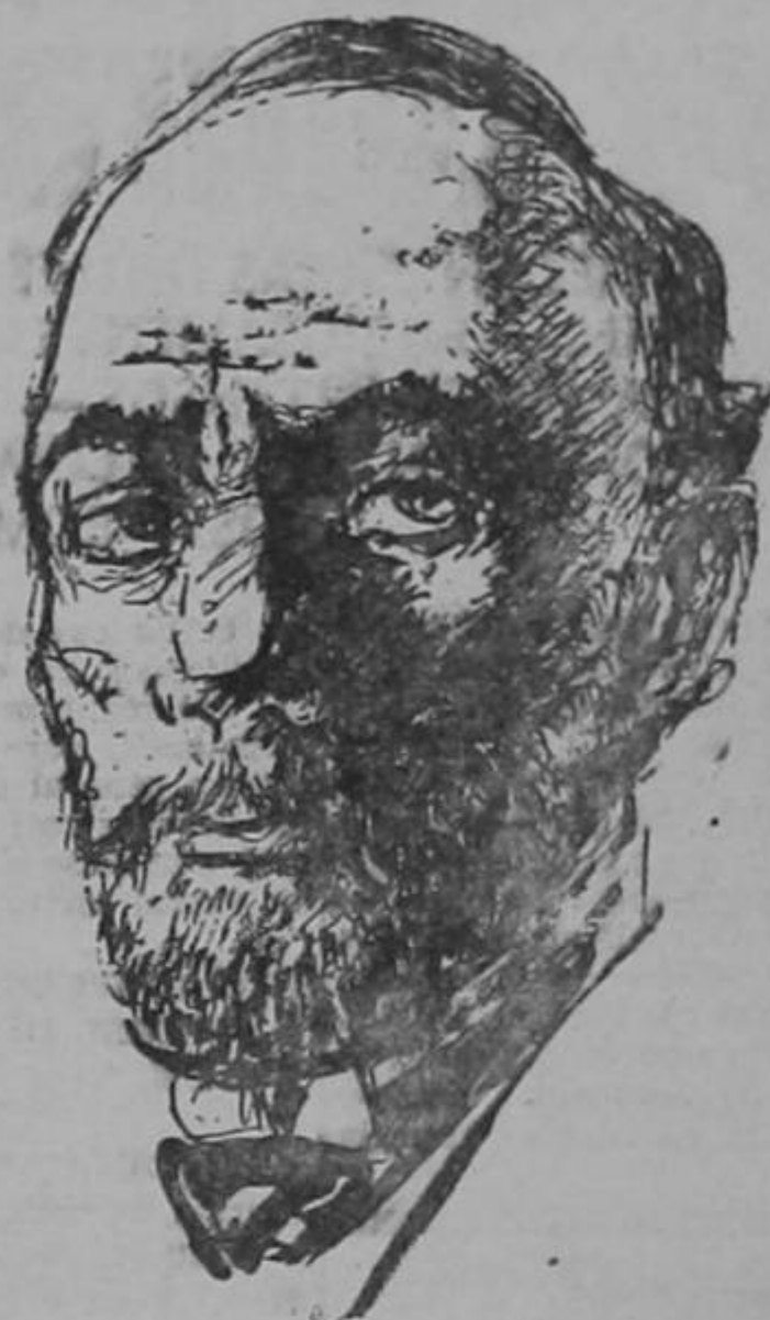
CONDE CARLO SFORZA

éste la aniquilará sin piedad. Agregó el jefe de gobierno que el Japón no puede seguir tolerando la influencia británica y norteamericana en la India. Dijo también que el gobierno chino de Chungking está perdiendo terreno y que las fuerzas japonesas han derrotado decisivamente a las tropas de Chiang Kai Shek en las provincias de Chekiang y Kiang, si, cortando la principal arteria de comunicaciones y transportes de que disponía el régimen chino mediante la ocupación del Han Khow".