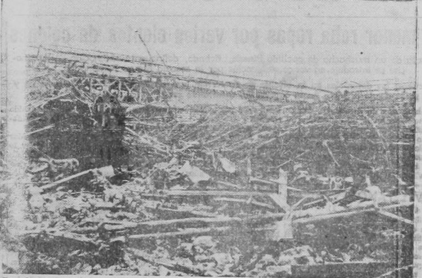
Esta fotografía que ha podido llegar hasta nosotros desde la Francia ocupada, demuestra los destrozos causados por la aviación británica en las fábricas de materiales bélicos Renault, utilizadas por los nazis. Una informe masa metálica es todo lo que queda de este poderoso establecimiento industrial.