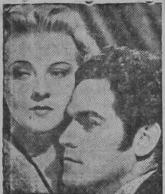
SERENATA DE AMOR

Próximo domingo—Ilona Massey y Alan Curtis, en