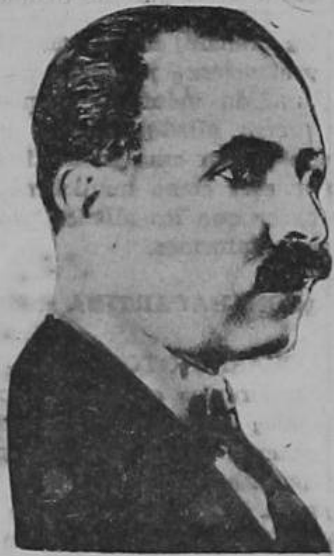
Presidente ARROYO DEL RIO

En este día de gloria para la noble nación hermana, LA RAZON presenta a su digno Presidente, así como a