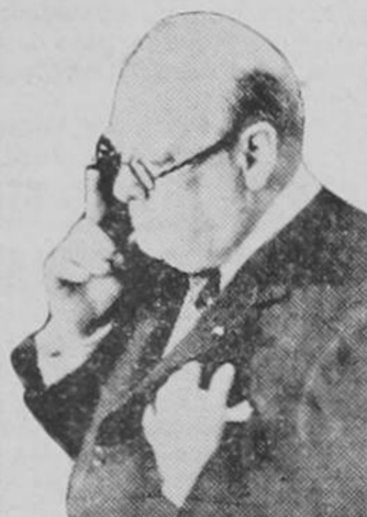
CHURCHILL QUIEN PERMANECIO CUATRO DIAS EN MOSCÚ

fascismo. El conde Sforza llegó escoltado por numerosos automóviles de delegados italianos que fueron a esperarlo a mitad del camino, mientras que en el Parque Hotel le esperaban otros legados que le recibieron con gran entusiasmo. El conde que actualmente cuenta 72 años, es un hombre alto y de enérgico continente a quien aparentemente no ha fatigado el largo viaje desde Nueva York.