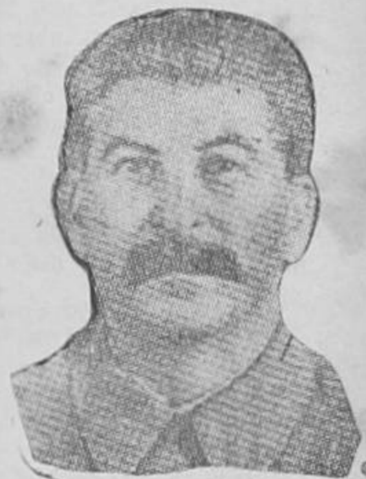
Stalin quien sostuvo dramáticas entrevistas con Churchill y Averill Harriman