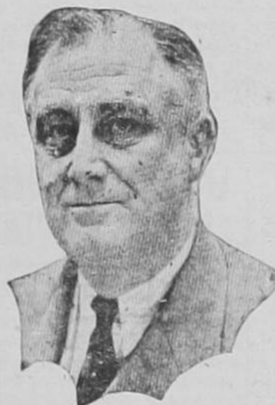
Roosevelt, quien dió credenciales a Harriman para que lo representara en la conferencia de Moscú