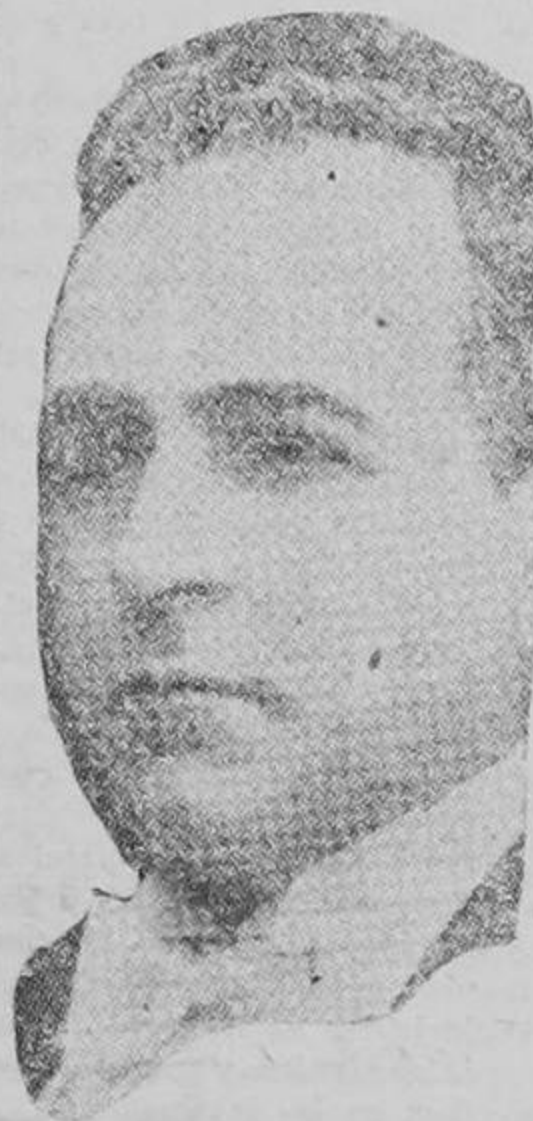
Presidente Getúlio Vargas

El gerente de la TACA ha suministrado a los miembros de la comisión dictaminadora toda clase de detalles sobre el negociado.