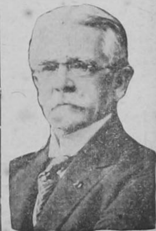
DR. BELISARIO PORRAS

Una figura venerable, un alto exponente de la vida cívica panameña. Se eclipsó anoche en la capital de la hermana del Sur: falleció el doctor don Belisario Porras. (Pasa a la Pág. SIETE)