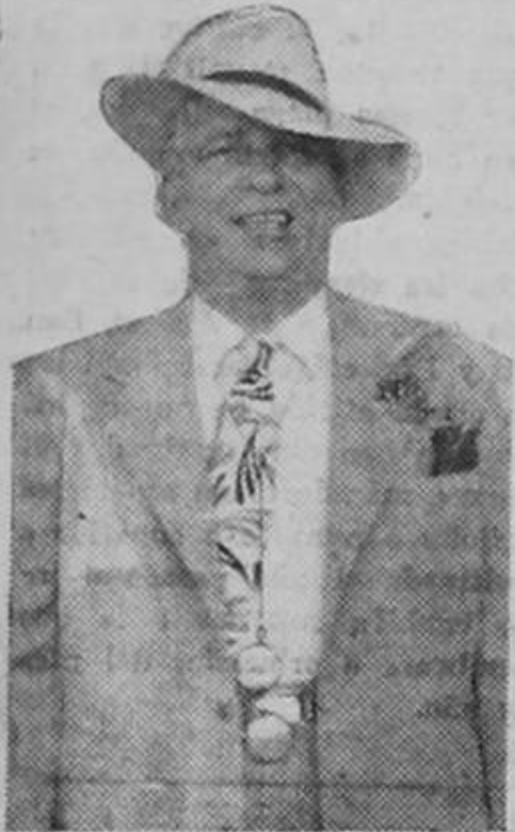
Dr. don Francisco Arias P.

Una de las figuras más conspicuas de la política de la hermana república de Panamá, se encuentra en Costa Rica: el doctor don Francisco Arias Paredes, quien es ampliamente conocido y estimado en nuestro país, donde goza de marcadas simpatías.