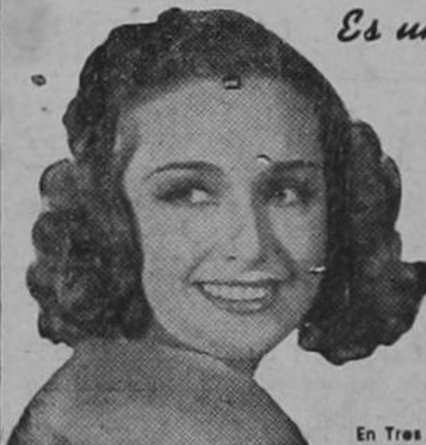
Rosemary Lane, estrella de Warner Bros. Pictures en "CUATRO HIJAS"

Pepsodent que contiene Irium. Al instante de aplicarlo en los dientes forma una espuma deliciosa y refrescante. Esa agradable sensación se conserva por largo tiempo. Pero si quiere una verdadera sorpresa — la mayor de todas — mírese después al espejo... se encantará al ver la nueva belleza radiante de sus dientes. Nada hace resplandecer los dientes de blancura como la crema dental Pepsodent... porque Pepsodent contiene además de sus famosos ingredientes de limpieza el nuevo y maravilloso descubrimiento — IRIUM. Empiece hoy mismo a usar Pepsodent y lucirá dientes encantadores.