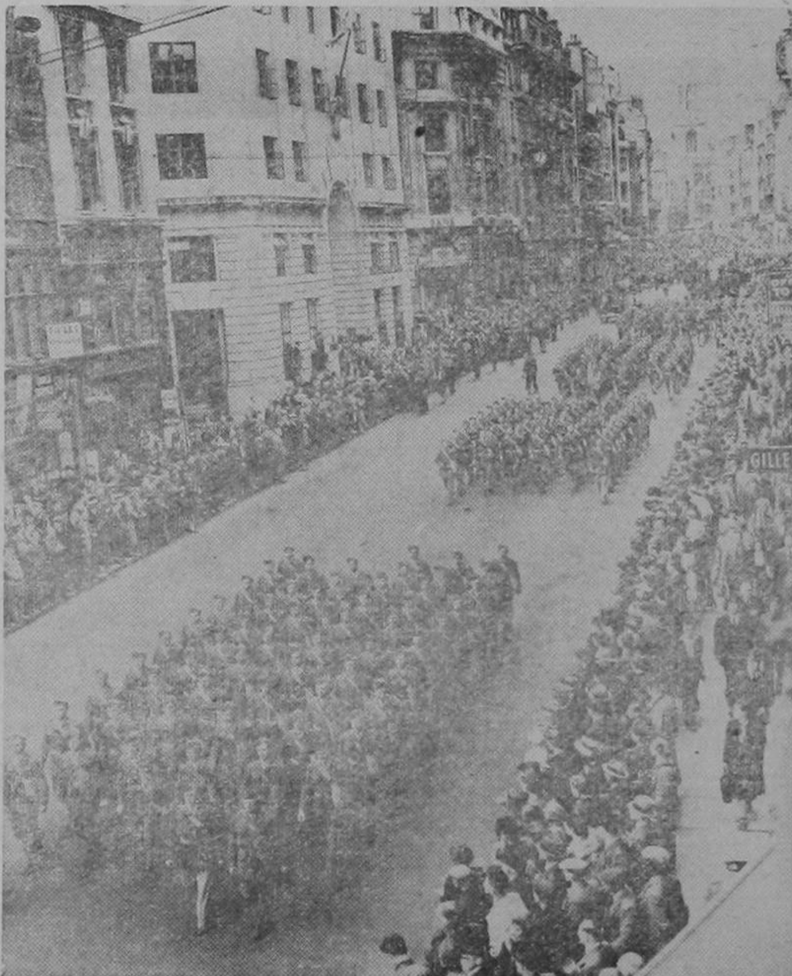
Una enorme muchedumbre aplaude entusiásticamente a las tropas norteamericanas que desfilan por Ludgate Hill con dirección a Guildhall. Este es el primer desfile militar de fuerzas armadas de los Estados Unidos en la capital del imperio británico durante la presente guerra.

Próximo jueves—Raúl de Anda y Amanda del Llano, en: LA VENGANZA DEL CHARRO NEGRO