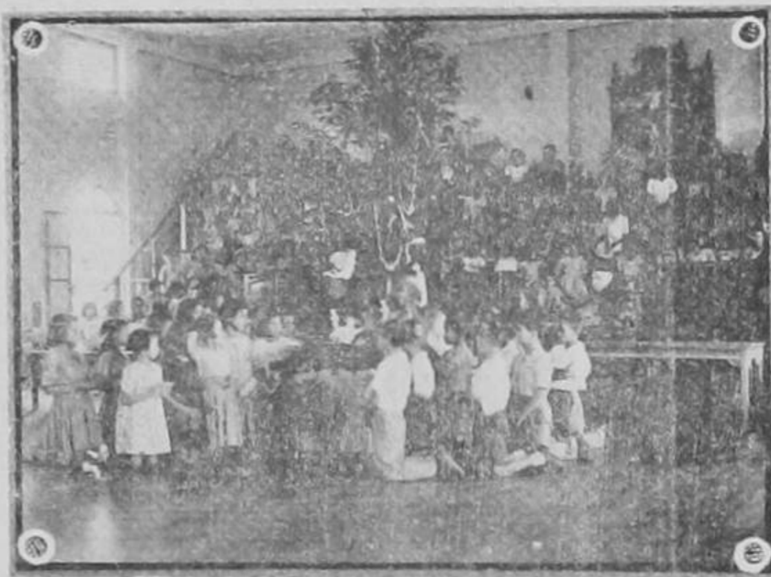
Los niños de la escuela del Colegio de Nuestra Señora de Sion, que este año asistieron en número de 150 a recibir el pan de la enseñanza, celebraron la clausura del curso lectivo con una bella fiesta y además, con actos de carácter religioso. La gráfica de arriba corresponde a uno de los oficios religiosos que se celebran con tal motivo.