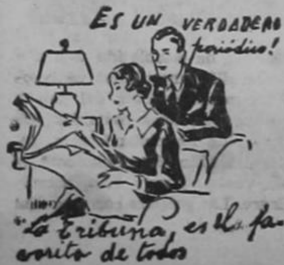
ES UN VERDADERO periódico!

Señor, que se cumpla ya tu mandato; que los hombres se abracen como hermanos bajo las venturas de la paz, de la libertad y de tu bendición de justicia.