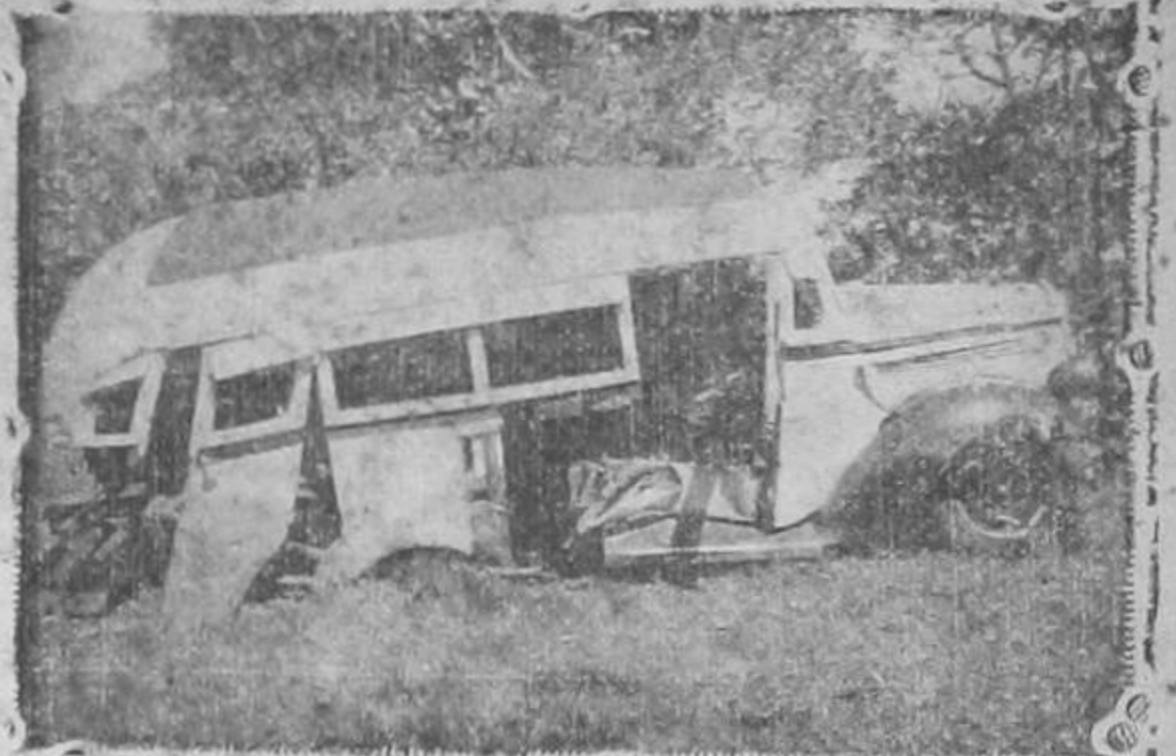
Estado en que quedó la cazadora 422, después del volcazo del 31 de diciembre, en que perdieron la vida dos personas, resultando heridas otras varias.