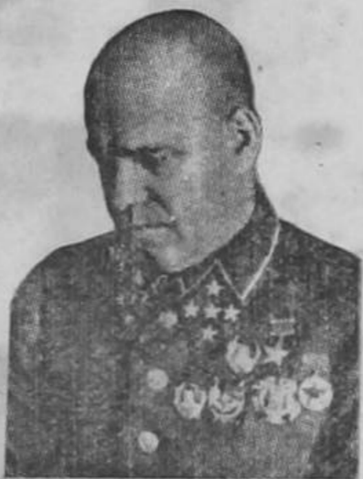
ZHUKOV, quien planeó la formidable y victoriosa ofensiva rusa de invierno

ga, cuyo número se ha reducido de trescientos mil a doscientos mil hombres, recibe ahora para su alimentación de cien a cien-