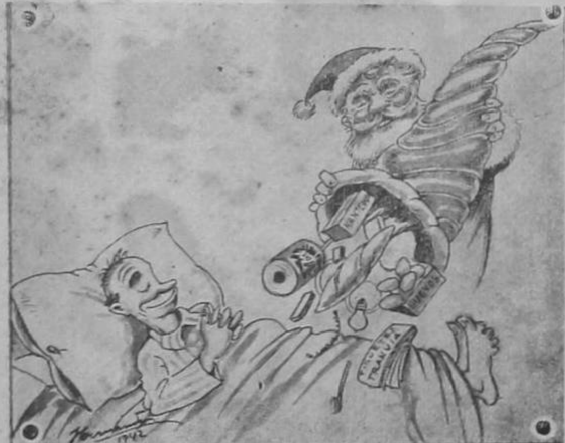
— ¡A esto se reducen las fiestas de San José! Juego y alcohol, eso es todo!