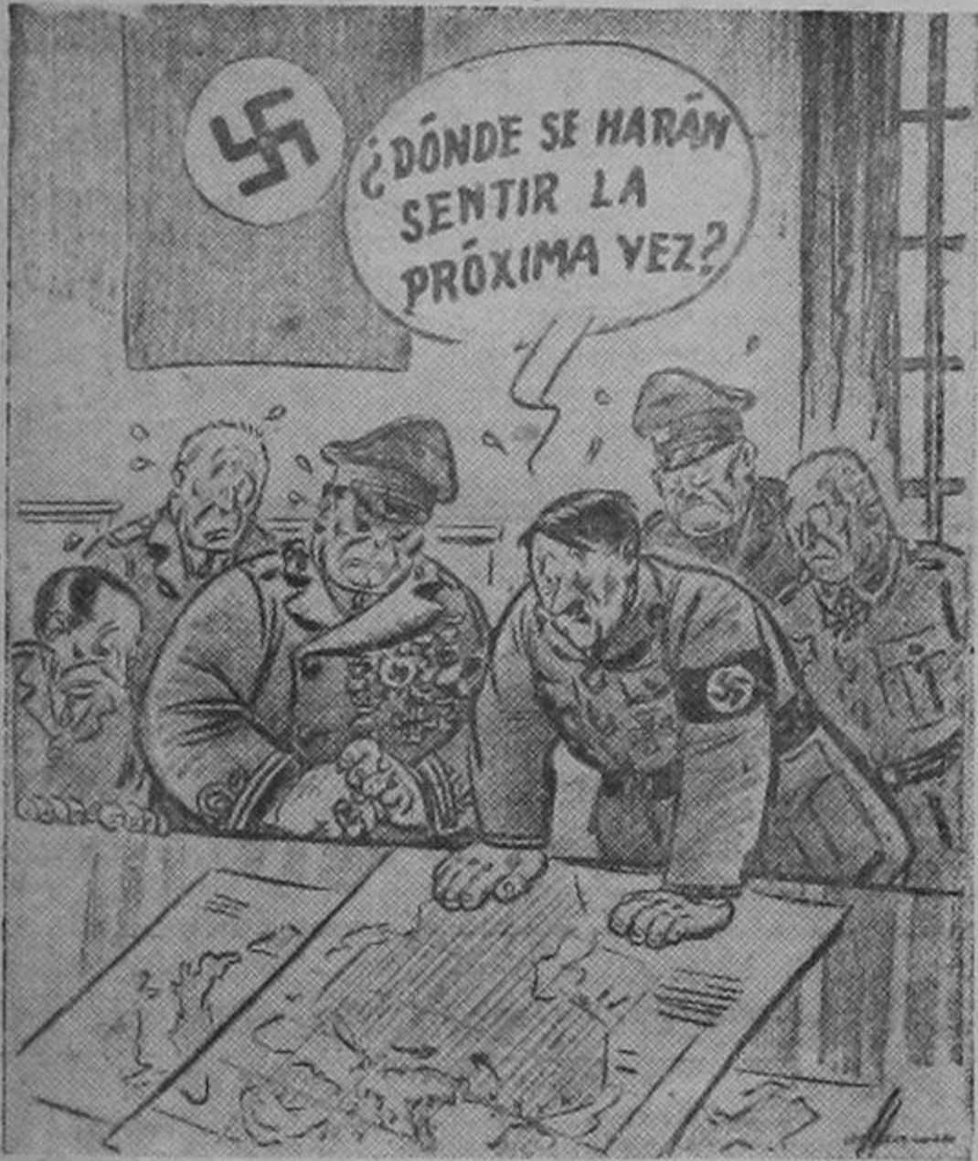
Herblock en el Washington News

Algunos observadores creen que el nuevo jefe de estado mayor general Zeitzler se ha vis-