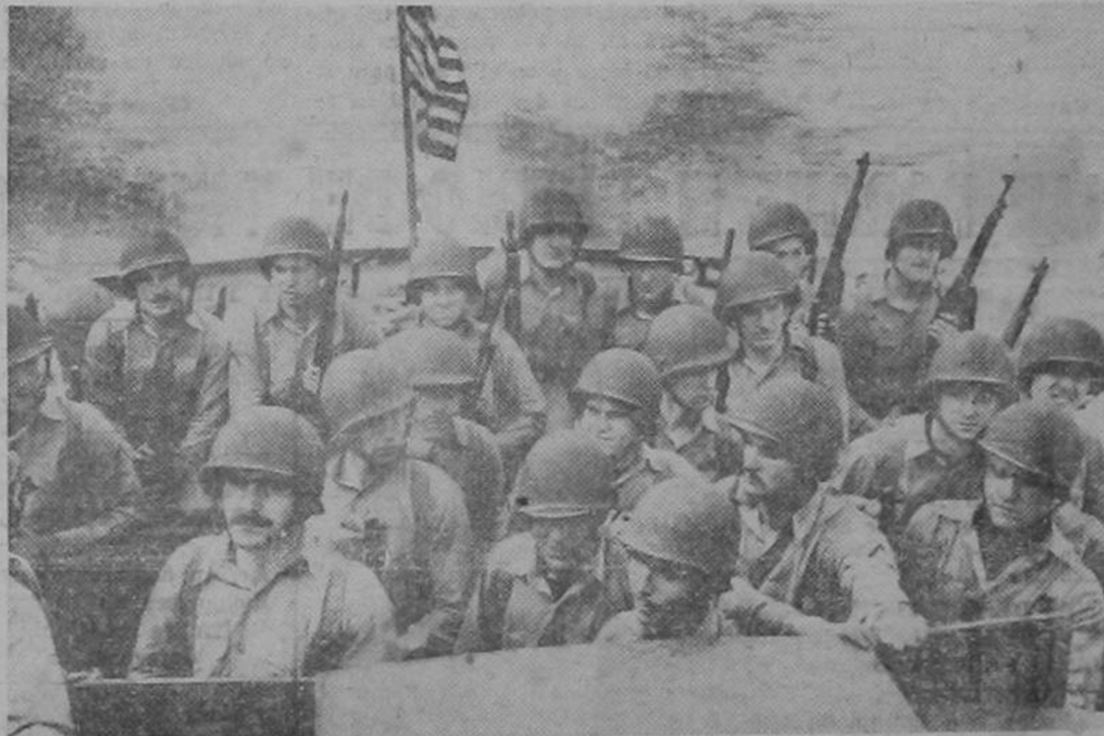
Tropas norteamericanas de choque dirigiéndose en una lancha a ocupar el objetivo que les ha sido asignado en las costas del Africa Septentrional Francesa, cuya victoriosa ocupación dió principio a la campaña de la liberación de Francia.