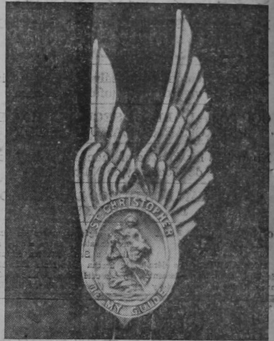
Medalla de San Cristobal, diseñada especialmente para las fuerzas aéreas norteamericanas por el P. A. E. Williams, capellán de un escuadrón aéreo. Esta medalla se ha hecho tan popular entre los combatientes alados, que las existencias no son suficientes para satisfacer los pedidos.