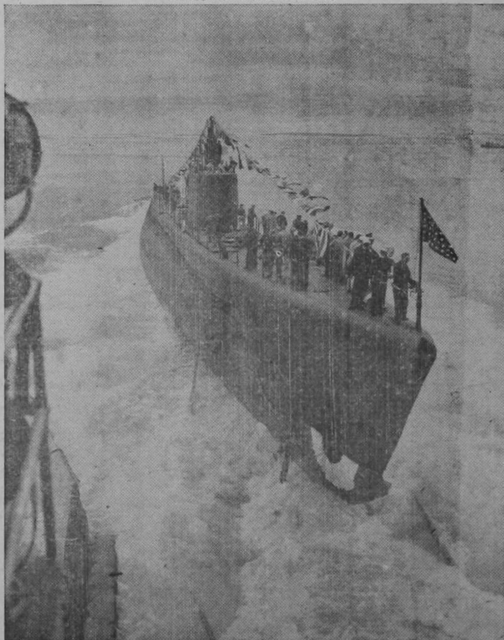
Botadura de uno de los modernísimos submarinos que están engrosando la poderosa flota de guerra que los Estados Unidos poseen en ambos océanos. Esta clase de submarinos, de largo radio de acción, ha echado a pique numerosos transportes japoneses en el lejano oriente.

Mañana en el Raventós: A las 1.15, 4, 7 y 9.15 en el CAPITOLIO a las 6.30 y 8.45 a las 6.30 y 8.45 en el AMERICA a las 6.45 y 9. La soberbia película mexicana: LOS TRES MOSQUETEROS con Cantinflas, el Rey del bacilón!