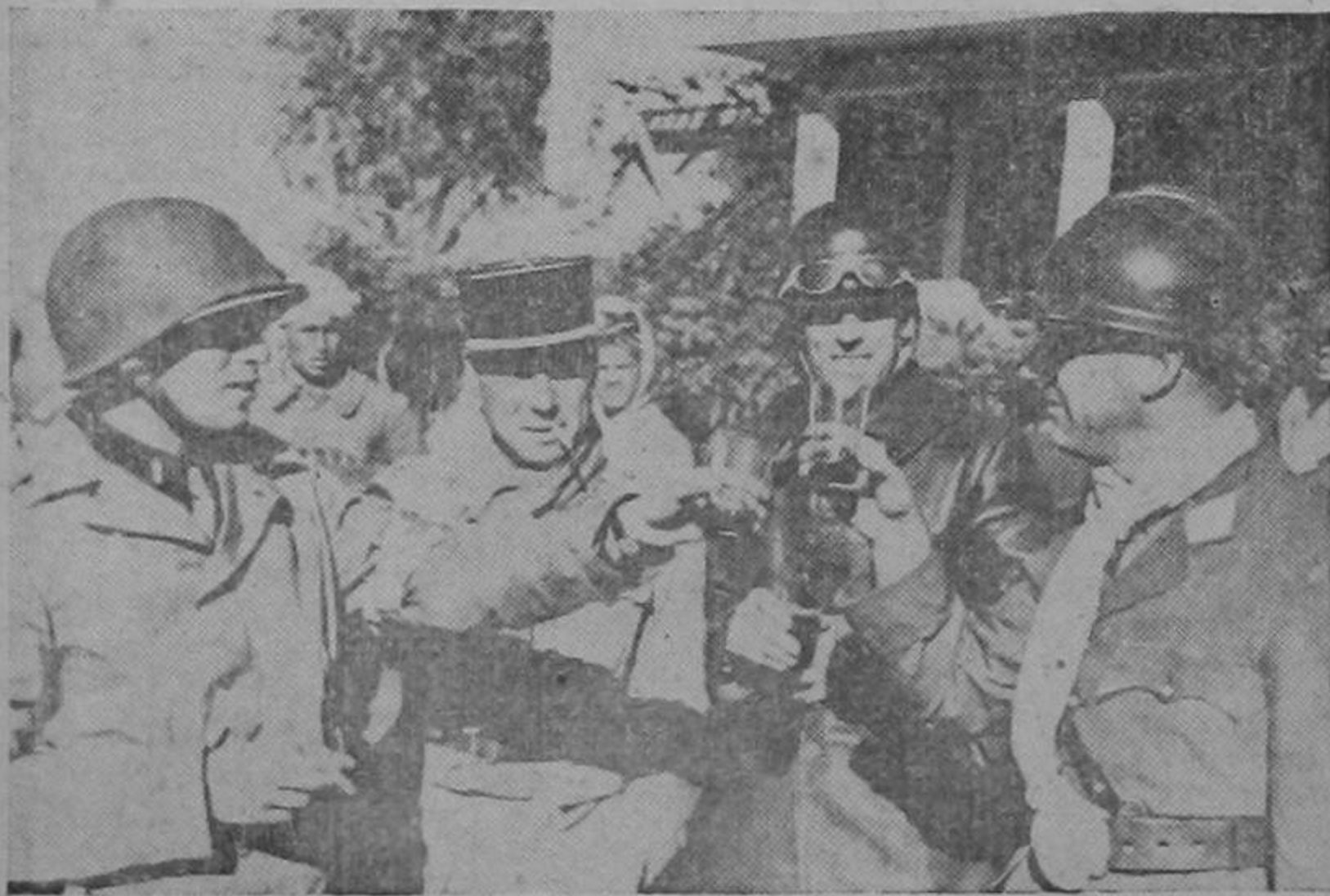
Soldados norteamericanos y miembros de la Legión Extranjera brindan, en estrecho compañerismo de armas, por la victoria de las Naciones Unidas, cuyas fuerzas acaban de iniciar victoriosamente, mediante la ocupación del Africa Septentrional Francesa, la campaña de la liberación de Francia.