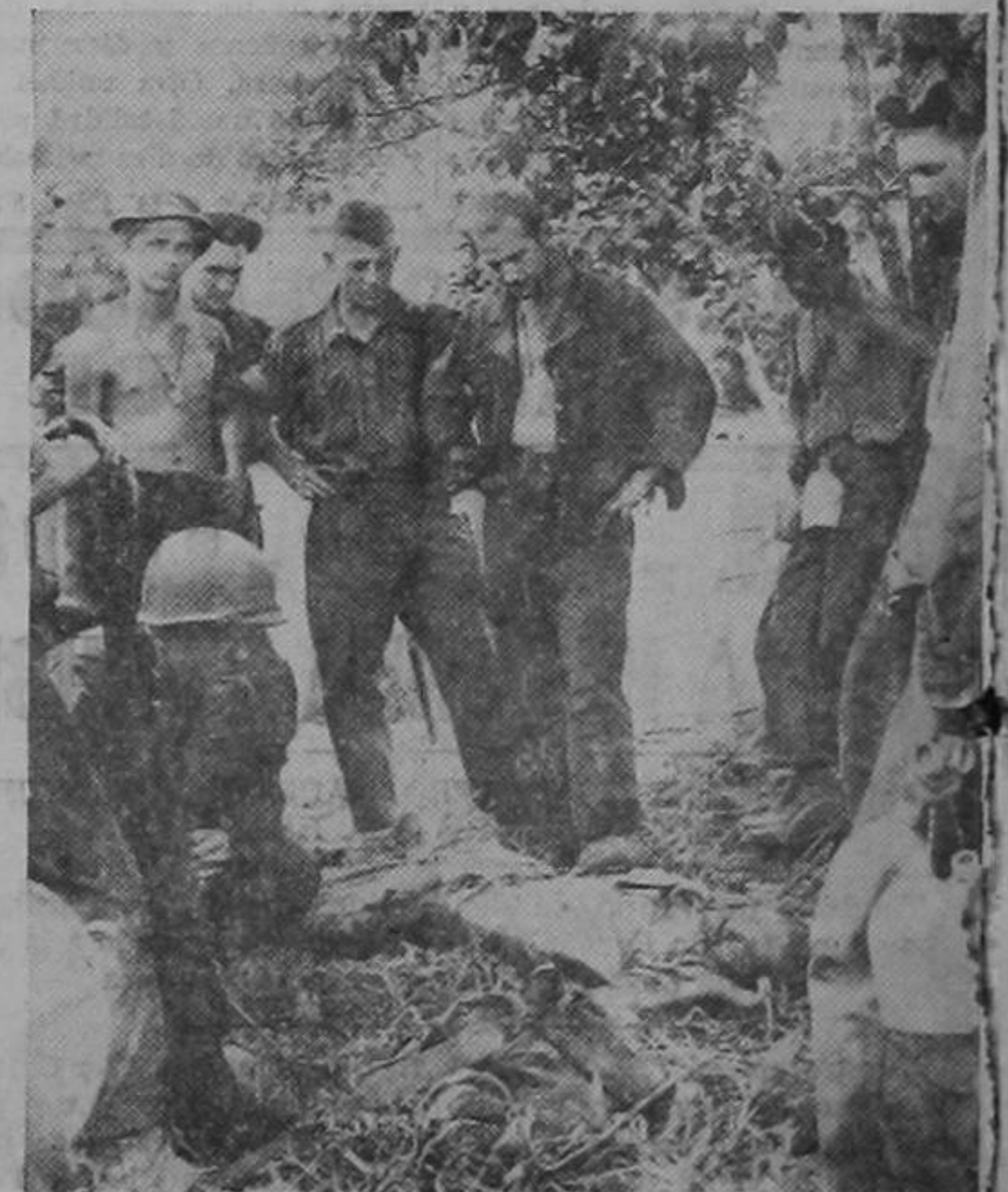
Un soldado japonés hecho prisionero por las tropas norteamericanas durante la victoriosa ofensiva de Nueva Guinea, cae a tierra exhausto por las numerosas privaciones.