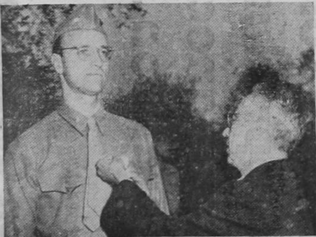
El señor Ismael Avilés, cónsul de la República Dominicana en Los Angeles, entrega en nombre de su gobierno la Orden del Merito Militar otorgada al teniente coronel James Roosevelt, hijo mayor del Presidente de los Estados Unidos, quien se distinguió por su valor y dotes de mando al frente de los comandos norteamericanos que iniciaron el ataque a las Islas Salomón.