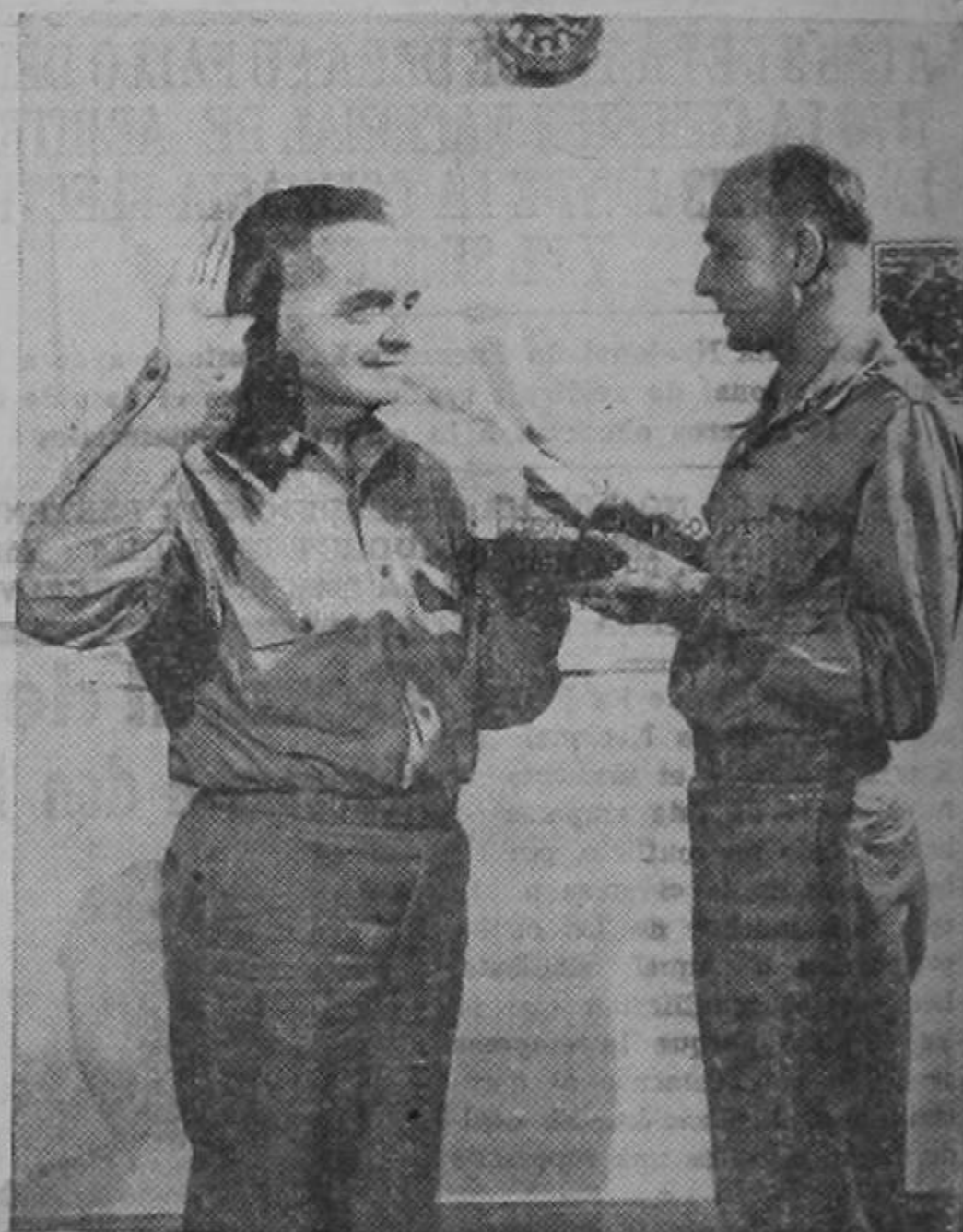
El Almirante William F. Halsey, a la izquierda, cuando prestó juramento al posesionarse del comando de la flota norteamericana en el Pacífico Suroeste. El héroe de tantas y tan gloriosas victorias sobre la flota japonesa, fué ascendido recientemente al grado de Almirante.