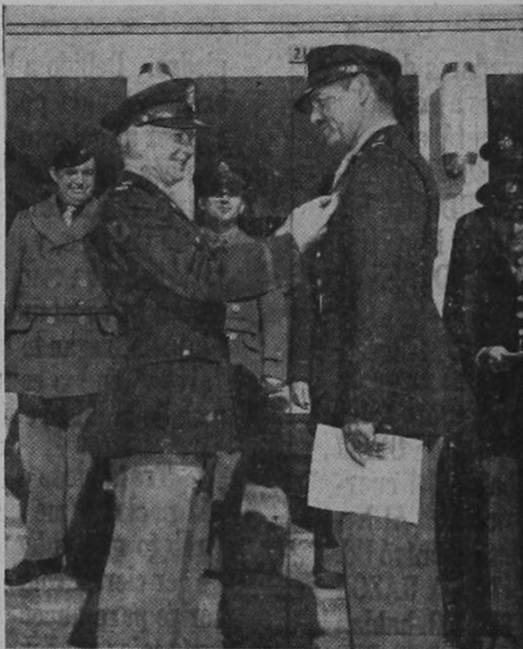
El famoso astro de la pantalla, Clark Gable, hoy día teniente del ejército norteamericano, recibe de manos del coronel W. A. Maxwell las alas de plata de los artilleros de la aviación de los Estados Unidos. Gable ha pedido que se le envíe cuanto antes al frente de batalla.