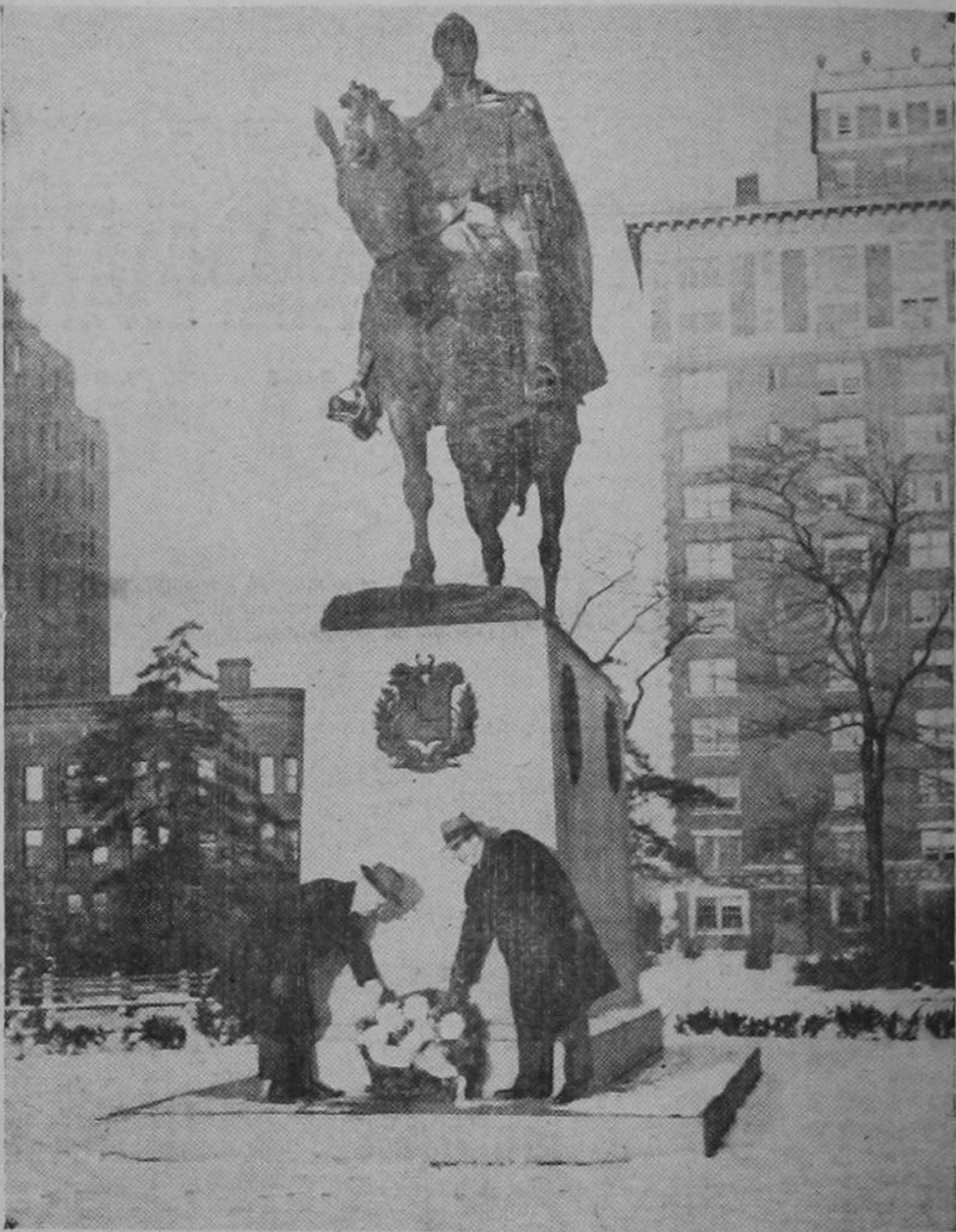
Los dirigentes de la Sociedad Panamericana de Nueva York colocan una corona de flores ante la estatua del Libertador Simón Bolívar, con motivo de celebrarse el 112 aniversario de su muerte y el primer centenario de la traslación de sus restos de Colombia a Venezuela.