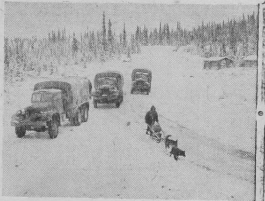
El transporte de abastecimientos para las tropas norteamericanas a través de la carretera militar de Alaska, cuyo empalme con la carretera panamericana asegura el perfecto enlace entre todos los países de este continente.