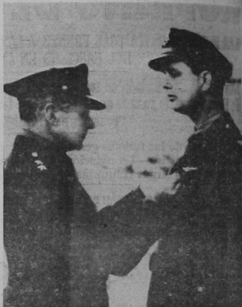
El Mayor General James Doolittle, quien dirigió la incursión aérea contra Tokyo y actualmente es jefe de las fuerzas aéreas en el Africa Septentrional prenda la Cruz de Aviación por Servicios Distinguidos sobre el pecho del Teniente Coronel Elliot Roosevelt, hijo del Presidente de los Estados Unidos. La condecoración le fué concedida por sus atrevidas misiones sobre territorio enemigo. Esta fotografía fué enviada por radio desde Londres a Nueva York.