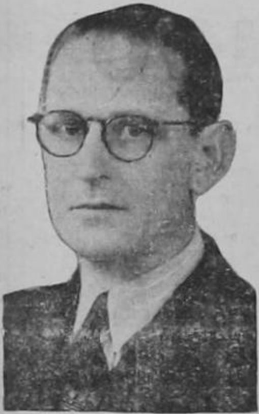
Excmo. señor don CARLOS MANUEL ESCALANTE

Ministro de Hacienda y ad-interim de Relaciones Exteriores