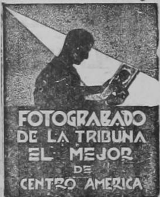
FOTOGRAFADO DE LA TRIBUNA EL MEJOR DE CENTRO AMERICA