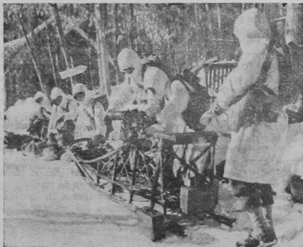
Tropas estadounidenses entrenan perros de trineo para maniobras militares. Los perros son habituados a los ruidos de combate y son utilizados para conducir ametralladoras instaladas en trineos.