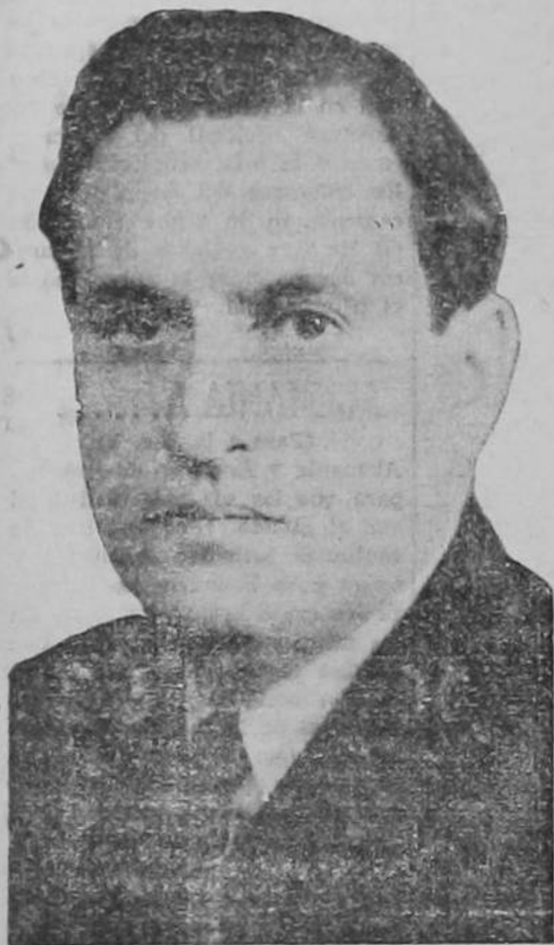
Excmo. Sr. Dr. DON RAFAEL ANGEL CALDERON GUARDIA, Presidente de la República