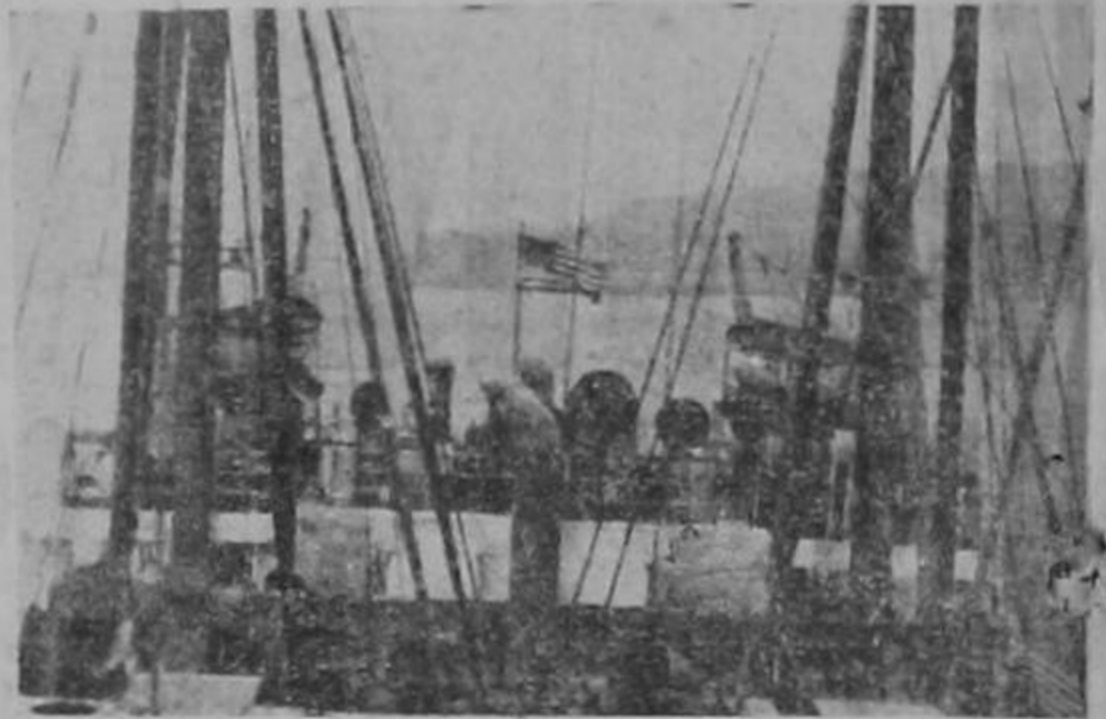
EL BARCO DEL EJERCITO estadounidense "American Legion" en el Puerto de Petsamo.