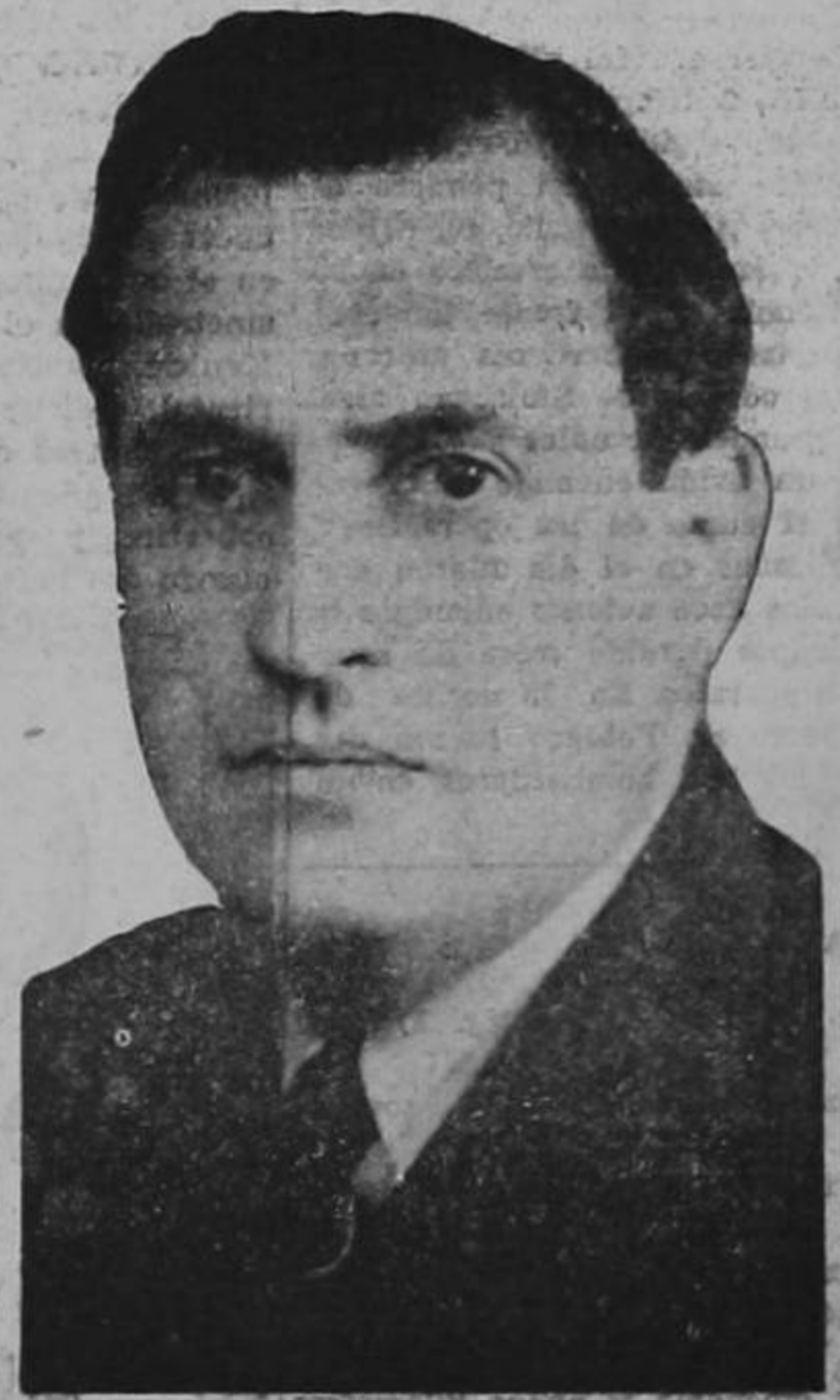
Excmo. Sr. don RAFAEL ANGEL CALDERON GUARDIA, Presidente de la República