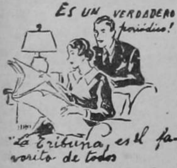
ES UN VERDADERO periódico!

El proyecto respectivo será elaborado por la directiva de la Cámara de Comercio y todas las reformas que se introduzcan tienen a hacer más efectiva la ley, de acuerdo esto con la política que al respecto mantiene el Poder Ejecutivo.