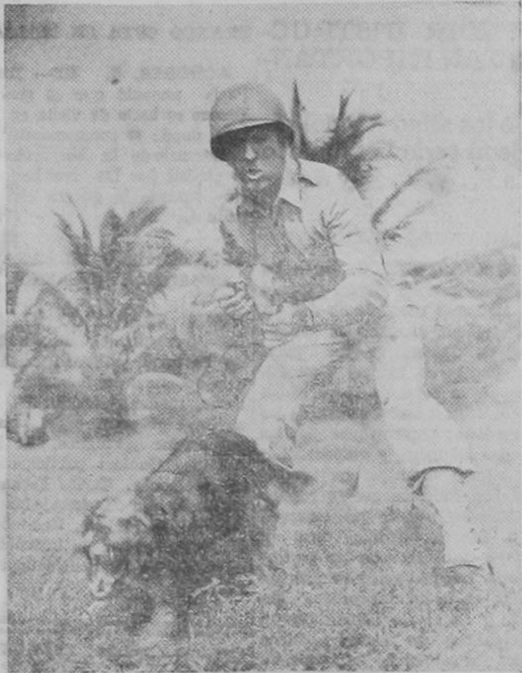
Uno de los magníficos ejemplares de perros que posee el ejército de los Estados Unidos para el servicio de vigilancia de las zonas militares. Esta fotografía fué tomada en la Zona del Canal.