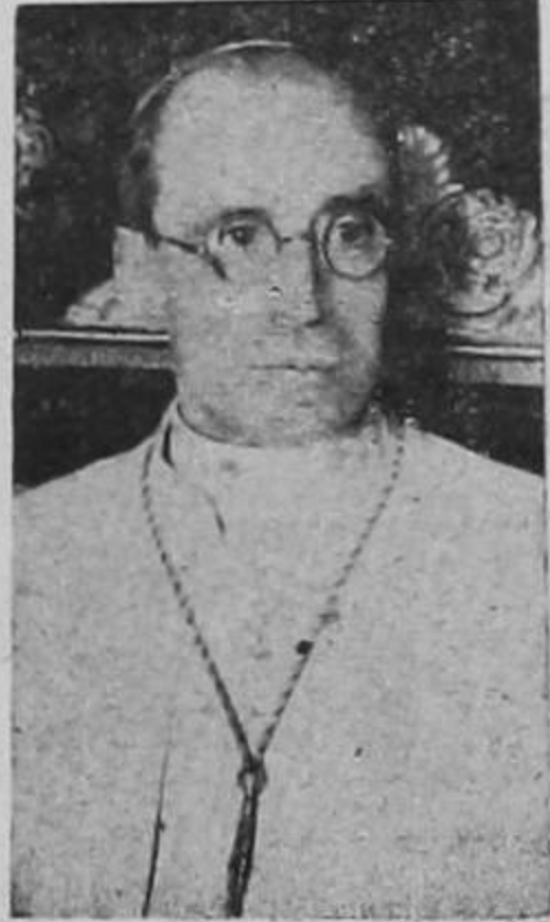
PAPA PIO XII, Jefe de la Iglesia Católica a quien se ha querido distanciar de España.

Hay en Madrid unos 30 correspondientes de periódicos alemanes, pero las noticias que envían raramente son destinadas a ver la luz en las publicaciones que ellos, aparentemente, representan. Muchos de estos "corresponsales" son especialistas en ingeniería de minas, y peritos en cuestiones militares y de agricultura. Sus despachos cotidianos se asemejan tanto a informes que podrían ser facilitados por el servicio de espionaje, que, al fin, el Gobier-