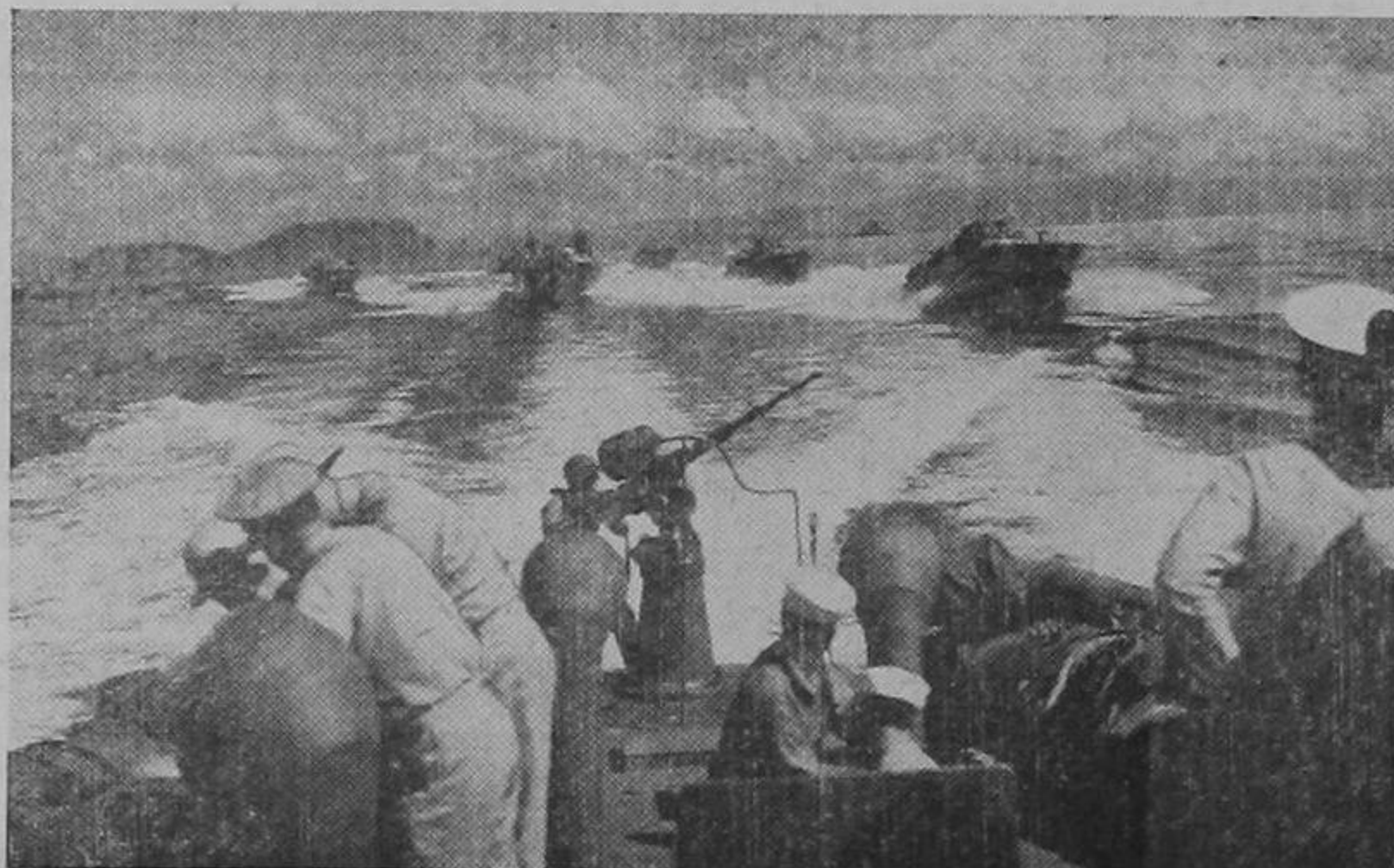
Botes torpederos norteamericanos en formación de combate. Estas pequeñas pero poderosísimas unidades navales han logrado ya significativas victorias sobre las mayores unidades de la flota enemiga.

Próximo Sábado—William Boyd, y Steffi Duna, en: LA LEY DE LA PAMPA