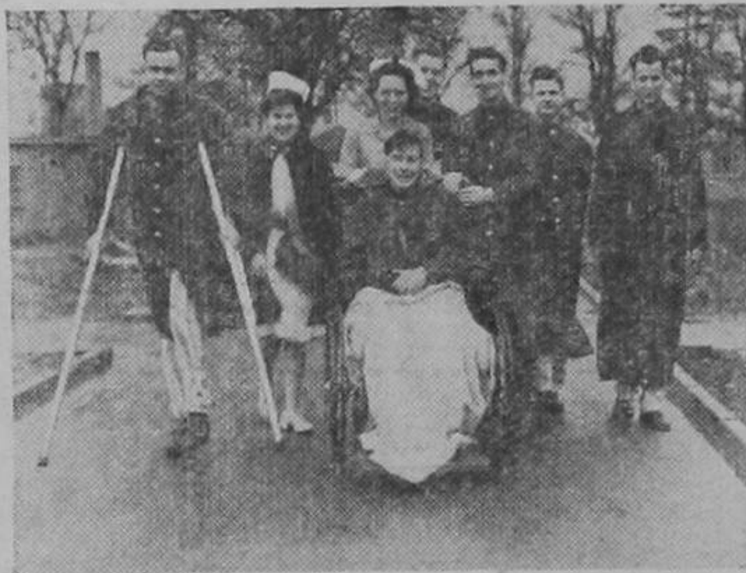
Soldados norteamericanos heridos en el frente tunisino, durante el periodo de convalescencia en un hospital militar de Inglaterra, en donde esperan ansiosos el momento de poder regresar al campo de batalla.

Mañana—Imponente estreno de aventuras y emociones que dejan la vida en suspenso! LA LEY DE LA PAMPA con William Boyd y Steffi Duna