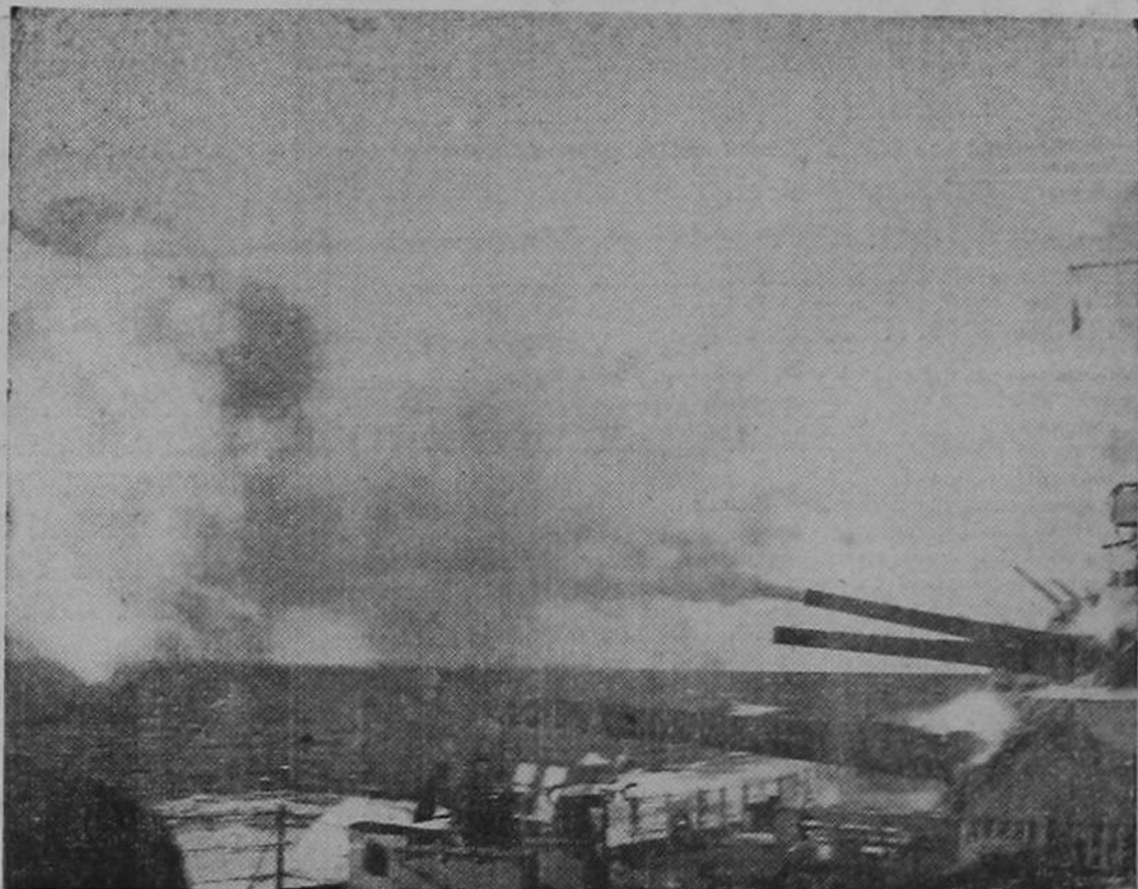
Un ultramoderno acorazado de batalla norteamericano disparando sus cañones de 16 pulgadas durante las pruebas de tiro.