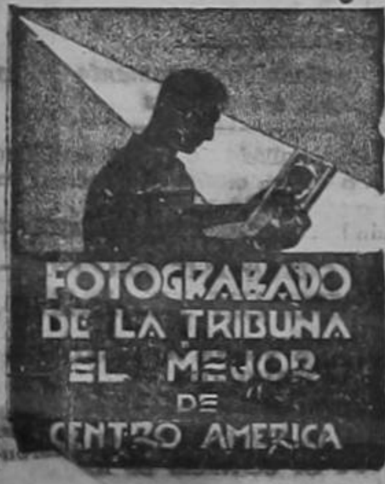
FOTOGRAFADO DE LA TRIBUNA EL MEJOR DE CENTRO AMERICA

le hapuesto un alto, ya sea por parte de Rusia o por la Gran Bretaña y los Estados Unidos, puede considerarse ya vencido por el único poder que ha llegado a conquistar el único poder que se propuso domar. Todo lo que en realidad quería Hitler, según el propio nos lo dijera en su libro "Mein Kampf", era dominar a Europa. Poco le importaban colonias africanas o asiáticas; Europa era la colonia que él codiciaba. Y si hubiera logrado apoderarse de Europa por la fuerza o por la razón, si Europa hubiese consentido en dejarse gobernar por el "Nuevo Orden" bajo la bota alemana, el mundo exterior se hubiera estrellado en vano contra las murallas de las fortalezas. Pero Europa lo rechazó, y Europa, sobre todo, es ese cautivo descalabrado y "worbun" continente, que ha llegado a probar a Hitler la inexorabilidad de la sentencia de muerte que solo espera, cual espada de Damocles, la hora de abate sobre su cabeza.