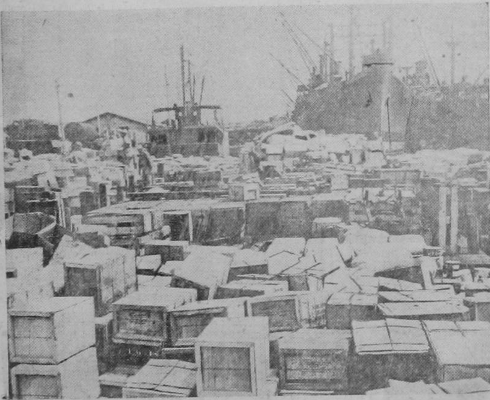
El aspecto que presenta este puerto del África Septentrional durante el descargo de barcos norteamericanos que acaban de llegar con toda suerte de abastecimientos para las fuerzas de los Estados Unidos, da una idea del tremendo esfuerzo que están haciendo los Estados Unidos para vencer en tan numerosos como apartados frentes de batalla a los ejércitos de la libertad.