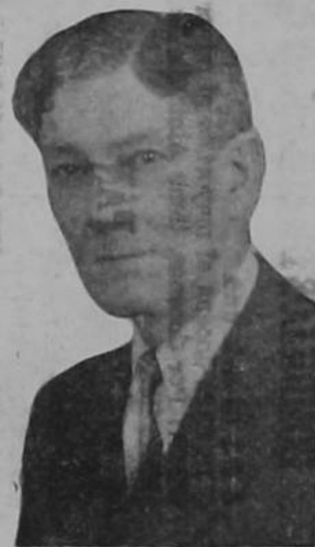
Don Arturo Quirós Carranza

Tras corta permanencia en San José, se dirige nuevamente a la hermana república de Guatemala, don Arturo Quirós, Ministro de nuestro país en aquella nación. LA RAZON le desea un feliz viaje.