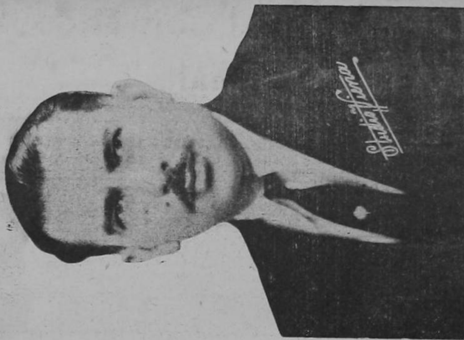
Lic. don Teodoro Picado Jefe y Candidato del Partido Republicano Nacional.