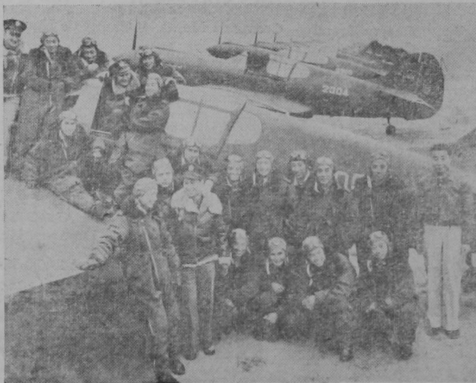
Un grupo de pilotos chinos que después de haber terminado satisfactoriamente su adiestramiento militar y aéreo, está participando con éxito en la lucha contra los japoneses. Los instructores, de los cuales dos aparecen en la parte superior de la fotografía, así como también los aparatos, son de puro origen norteamericano.