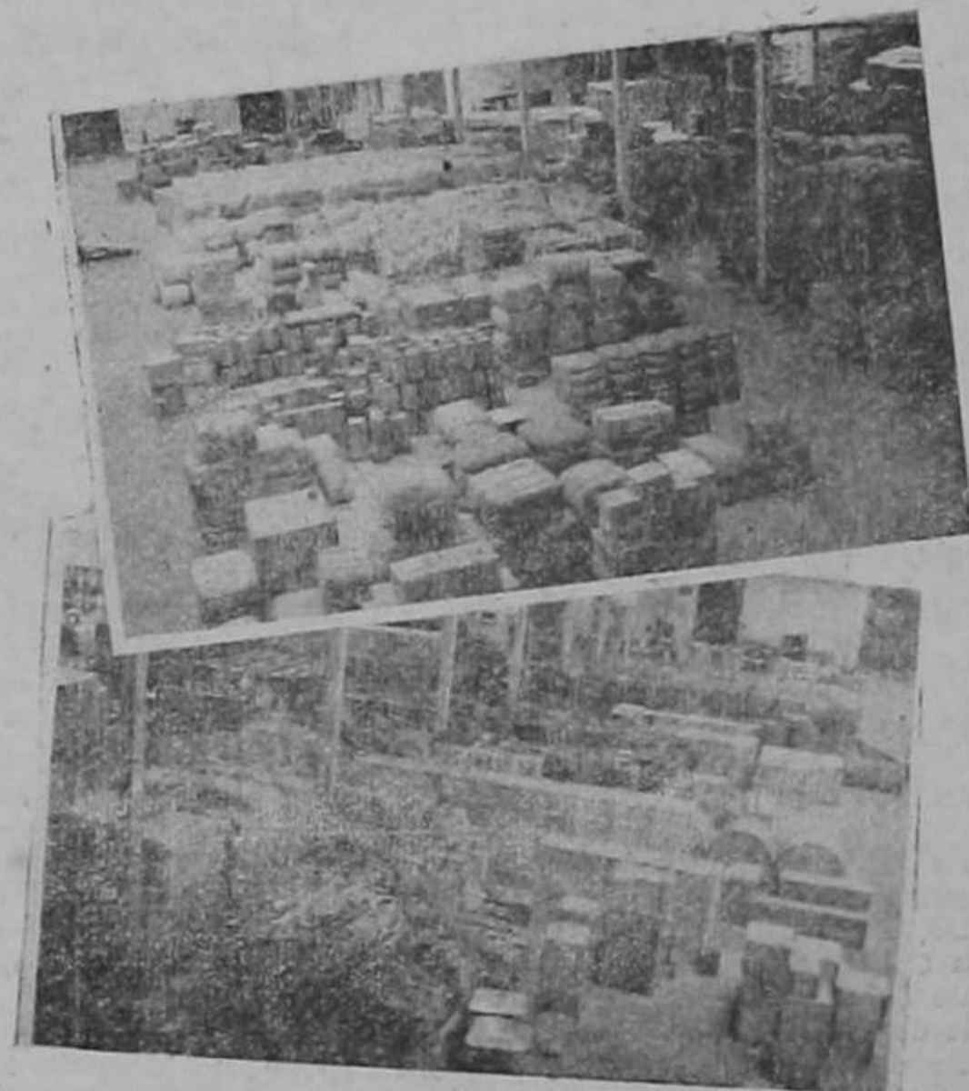
Las dos gráficas que nos envía nuestro activo redactor-corresponsal en Punta Arenas, muestran las grandes estivas de mercadería llegadas en los últimos cuatro días procedentes del exterior, así como las mercaderías listas para la exportación.