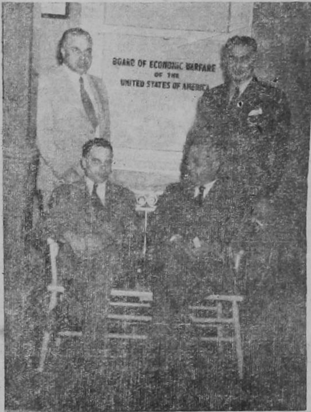
Miembros de la Oficina de Defensa Económica Americana, cuando visitaron la Oficina de Prioridades

R. A. CALDERON GUARDIA. El Secretario de Estado en el Despacho de Trabajo y Previsión Social. — CARLOS M. JIMENEZ.