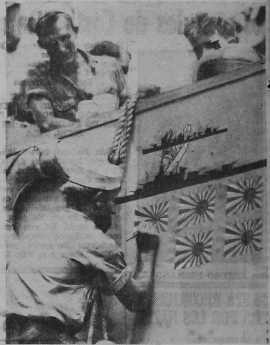
Un marinero norteamericano pinta en uno de los costados de su nave los signos que recuerdan las victorias obtenidas en lucha con la aviación y marina japonesas: cinco aviones derribados y dos barcos de guerra hundidos.

ro, municion, tanques, aeroplanos, armas de fuego, uniformes guerreros, etc., y decenas de millares de nuevos obreros hacen desbordar el número normal de sus poblaciones.