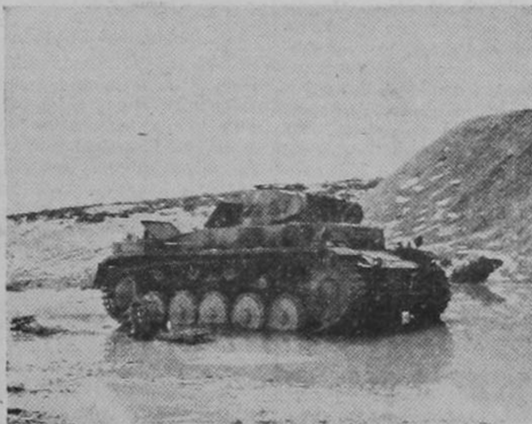
Un tanque nazi paralizado por el fuego de la artillería durante las recientes y victoriosas operaciones de las fuerzas armadas de los Estados Unidos en el frente de Túnez.