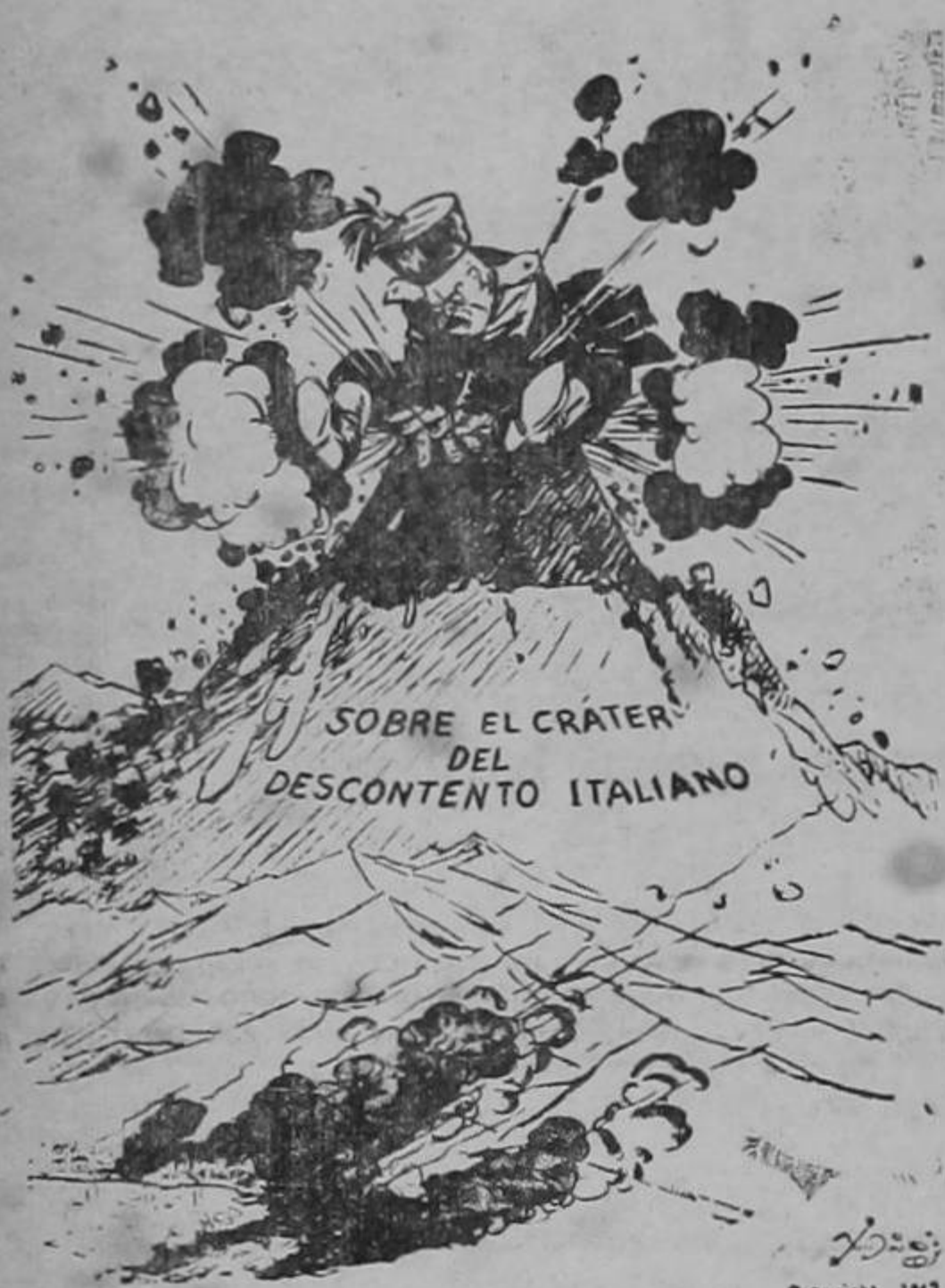
Ding Darling en el New York Herald Tribune

Honor a los bravos legiones de pilotos de la R.A.F., convertidos en los vencedores del espacio y en los portadores de la misión sublime de conquistar la victoria para la Civilización. Cúmplense hoy 25 años que los cuerpos de la Real Fuerza Aérea eran fundados. En aquel entonces, esas incipientes fuerzas fueron apenas auxiliares en la inmensa catástrofe que fue la guerra anterior. Un cuarto de siglo más tarde, la R.A.F. es la avanzada vigorosa, la primera unidad en el conjunto de las armas y ejércitos de guerra. Revolucionando toda idea de su utilidad, ella es la precursora y es la clave de la victoria, y en esta fecha gloriosa de su décimo quinto aniversario, queremos tributarle nuestro homenaje a la R.A.F. en la persona de su Jefe Supremo el Mariscal del Aire, Sir Portal el hombre que dirige las Alas de la Victoria.