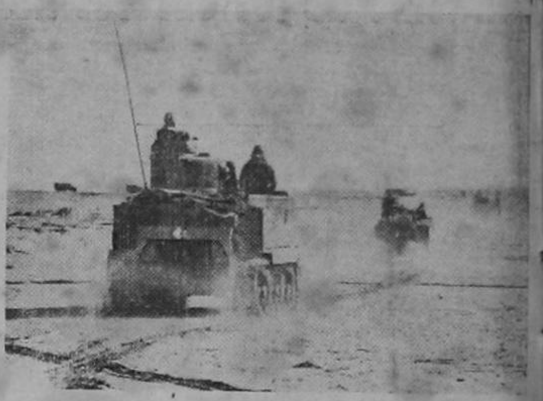
...ques norteamericanos al ataque de una posición nazi en el sector central de Tunes.