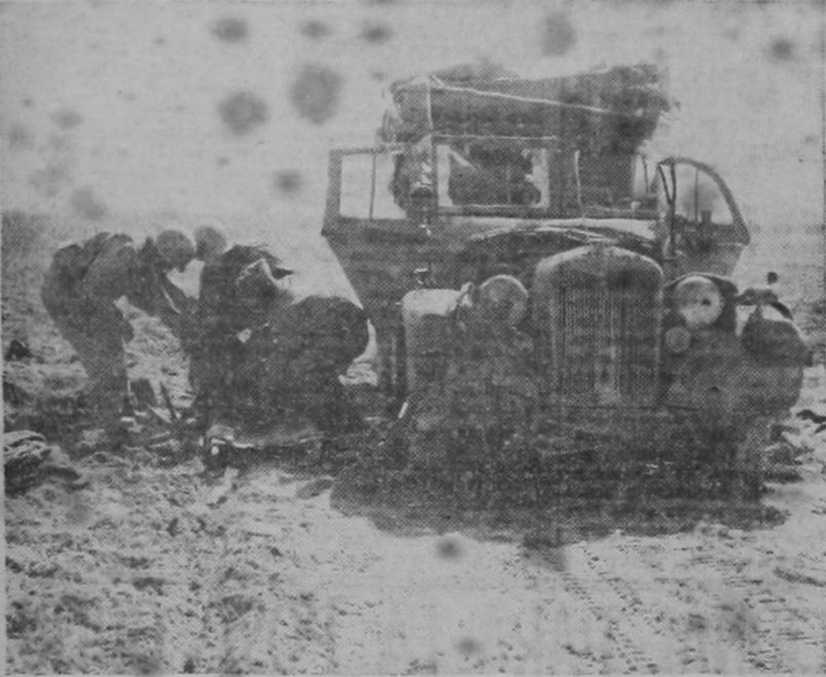
La ambulancia norteamericana coloca cuidadosamente sobre una camilla el cadáver de un soldado italiano muerto al volante de un camión destruido por las fuerzas armadas de los Estados Unidos durante una acción ofensiva en el frente de Túnez.