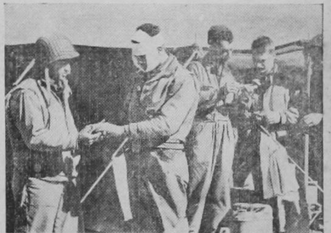
Soldados norteamericanos heridos en el frente de Túnez, reciben los primeros auxilios en un puesto médico militar no lejos de las líneas avanzadas. La perfecta organización de los servicios médicos de las fuerzas armadas de los Estados Unidos es uno de los factores que dan mayor seguridad y eficiencia a las tropas combatientes.