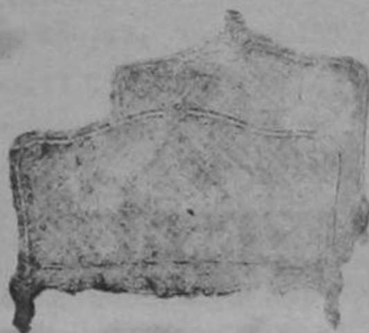
Garantiza sus trabajos

Se fabrican velas de todo tamaño y su calidad, y puede competir con las extranjeras marca BUQUE.