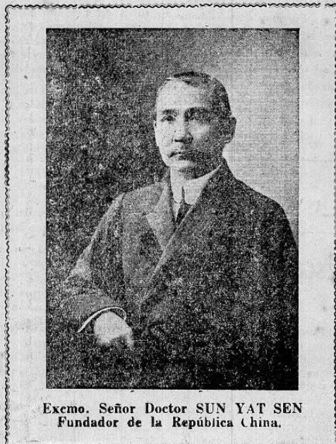
Excmo. Señor Doctor SUN YAT SEN Fundador de la República China.

a las siete de la noche en dicho Club, y la transmisión se llevará a efecto una hora después; pero caso de poder trasladar el micrófono a los salones donde será la recepción, entonces se celebrarán simultáneamente ambas cosas.