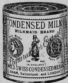
Facsimil de la lata de leche marca "La Lechera"

A los señores Médicos, Hospitales, Comerciantes, Madres de familia, y al público en general.