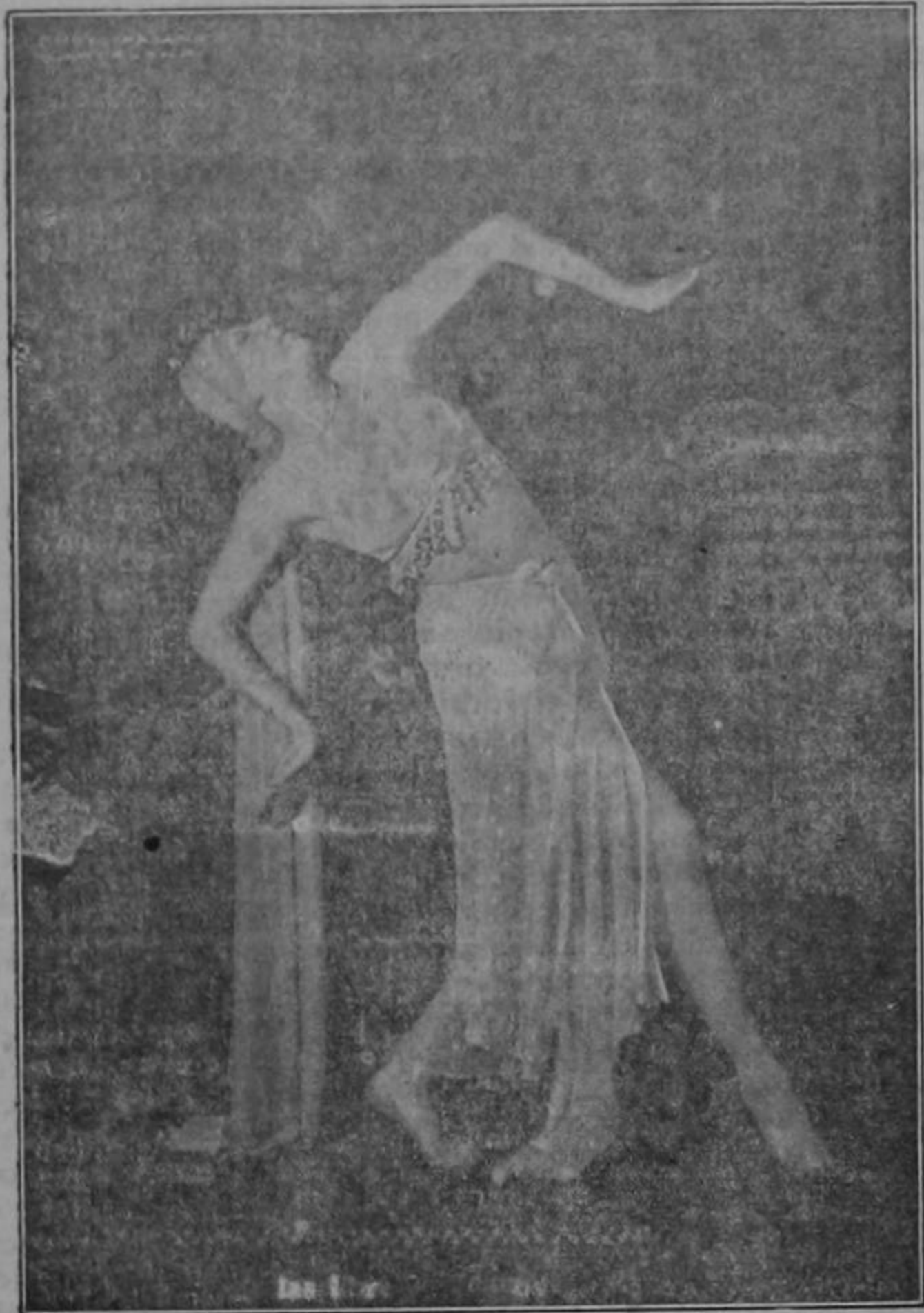
Lou, bailarina de la Compañía Velasco, de escultural cuerpo