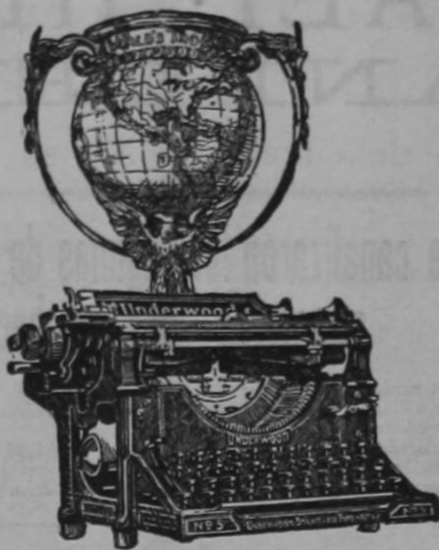
ARANGO & Co. S. A.

Bien venida sea la gran artista mexicana a nuestra Costa Rica. La prensa y el público costarricense le presenta su respetuoso saludo, y desea que se abran para ella y su compañía de par en par las puertas del suntuoso Teatro Nacional.