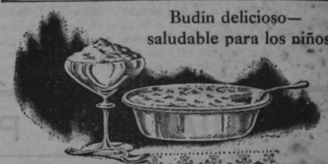
Budín delicioso—saludable para los niños