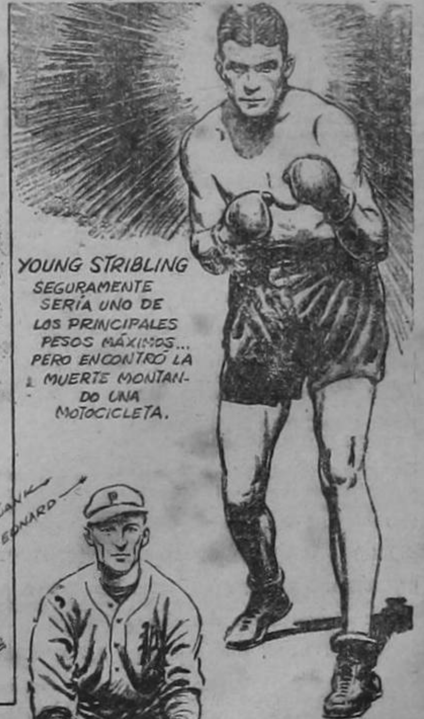
YOUNG STRIBLING SEGURAMENTE SERIA UNO DE LOS PRINCIPALES PESOS MÁXIMOS... PERO ENCONTRO LA MUERTE MONTANDO UNA MOTOCICLETA.