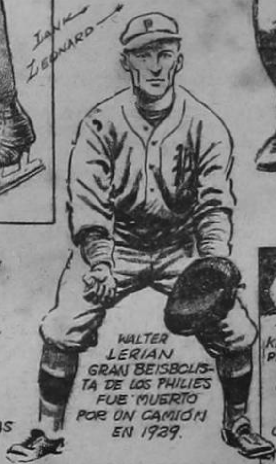
WALTER LERIAN GRAN BEISBOLISTA DE LOS PHILLIES FUE MUERTO POR UN CAMIÓN EN 1929.

OTROS FAMOSOS DEPORTISTAS CUYAS CARRERAS ACORTO EL DESTINO.