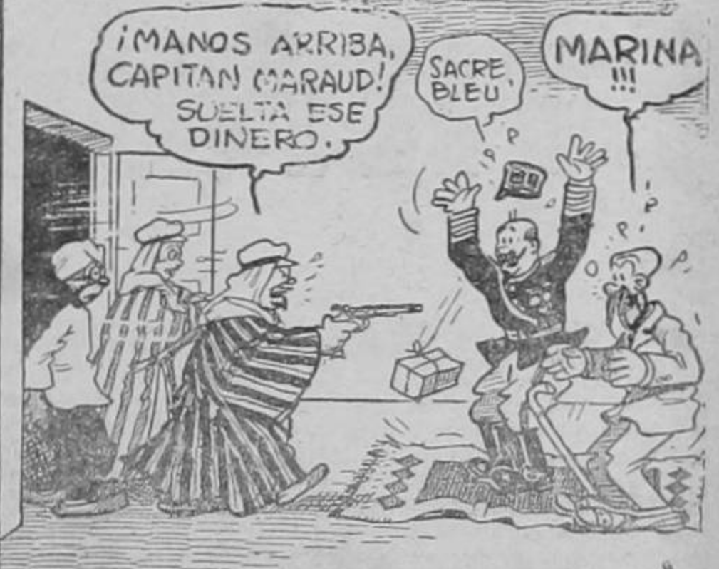
MAÑANA: UNA VICTIMA DE CUPIDO....