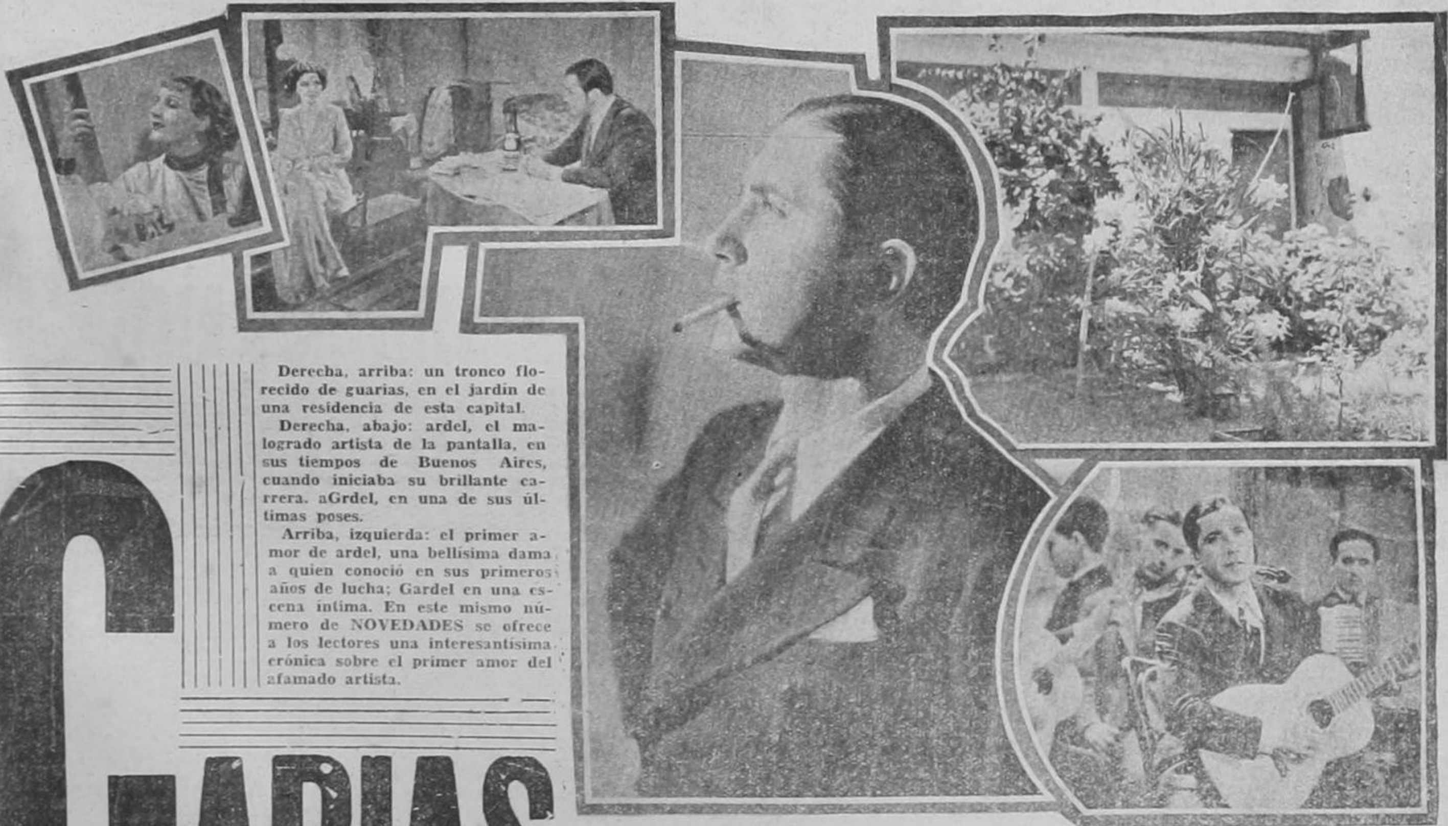
Derecha, arriba: un tronco florecido de guarías, en el jardín de una residencia de esta capital.