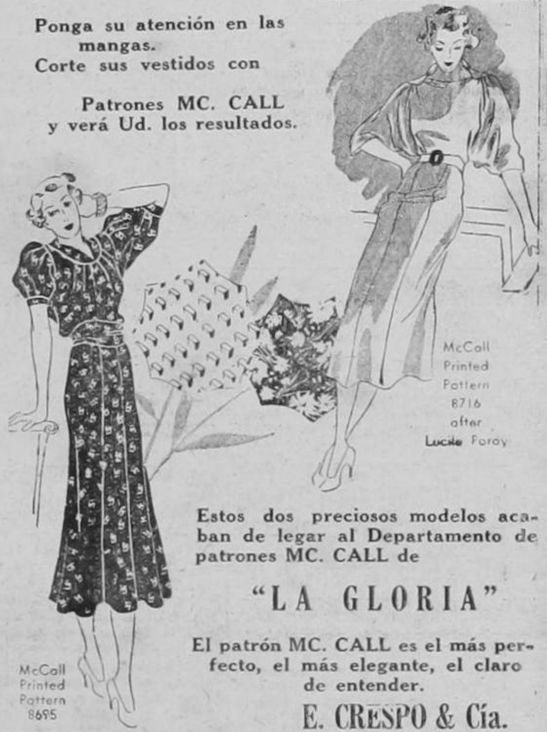
McCall Printed Pattern 8716 after Lucile Foray

Patrones MC. CALL y verá Ud. los resultados.