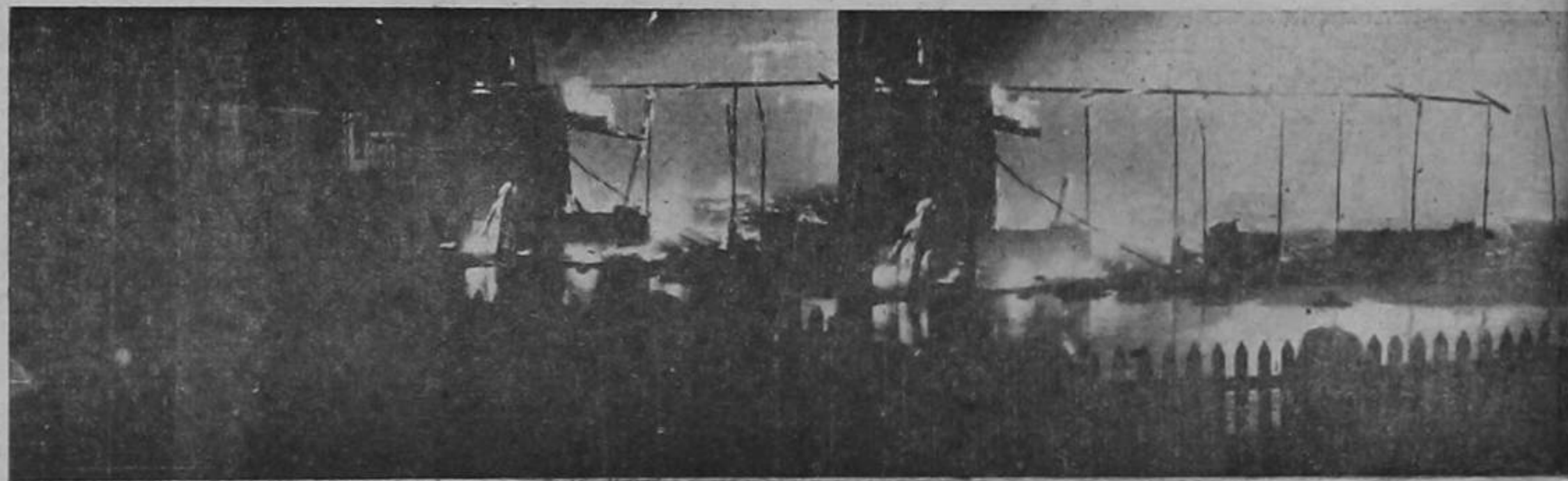
SOLAMENTE UN COMERCIANTE ESTABA ASEGURADO EN $ 20.000. — ESTE ES UN

Más de $ 150.000 se perdieron en el incendio