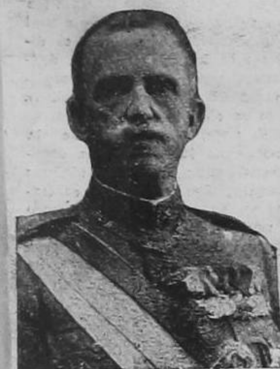
S. M. EL REY DE ITALIA

LONDRES, 9.—Mensajes de prensa procedentes de Addis Ababa y publicadas en esta capital en las ediciones de la mañana informan que el vocero italiano anunció que Italia ha decidido la anexión completa del territorio etíope a la corona de Italia. El mariscal Pietro Badoglio, comandante en jefe de los ejércitos invasores en Abisinia será nombrado el primer virrey de la nueva dependencia, pues como tal será tratada la tierra del Negus. Hasta el nombre anterior de Etiopía desaparecerá del mapa y Su Majestad el rey de Italia será proclamado emperador de los vastos territorios conquistados por sus legiones victoriosas.