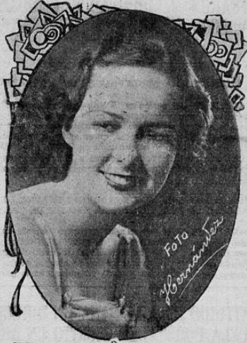
SRITA. CECILIA CARRANZA GALLEGOS

EL ELEGANTE TE OFRECIDO POR EL CLUB UNION A LA PRIMERA DAMA DE LA REPUBLICA DE PANAMA. LINDAS ASISTENTES