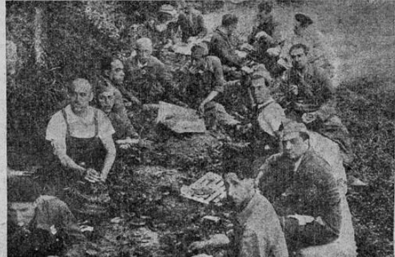
En el frente de Guadarrama un grupo de milicianos. Aparece con ellos, Largo Caballero, el actual jefe del gobierno de Madrid.