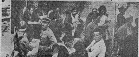
1. La entrada de los nacionalistas (rebeldes) a Irún.—2. Milicias gobiernistas desarmadas en territorio de Francia después de abandonar a Irún y cruzar la frontera

A VEINTE KILOMETROS DE TOLEDO LA COLUMNA DEL TERCIO EXTRANJERO Con la columna del tercio que avanza sobre Toledo, 24.— Por Keyreld Peckaré, corresponsal especial de la UNITED PRESS y de LA TRIBUNA.